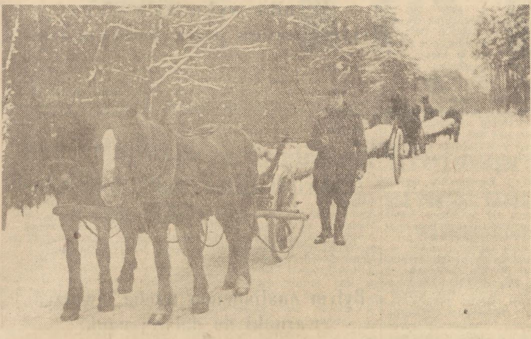
Matorni chłopi z gromady Ludwików w pow. Gostynin przewożą drewno z lasu do tartaku w Gostynie.