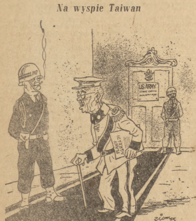
— O co pan się martwi, Mr. Czang Kai-szek? — O te 500 milionów... — Jesteś obywatelski, chyba damy... — Ale mnie chodzi o te 500 milionów Chińczyków, których mam zawojuować!

Austriacy robotnicy obchodzili uroczystości 19 rocznicę walk z Heimwehram (f) WIEDEN (PAP). Austriacka klasa robotnicza uroczysto-