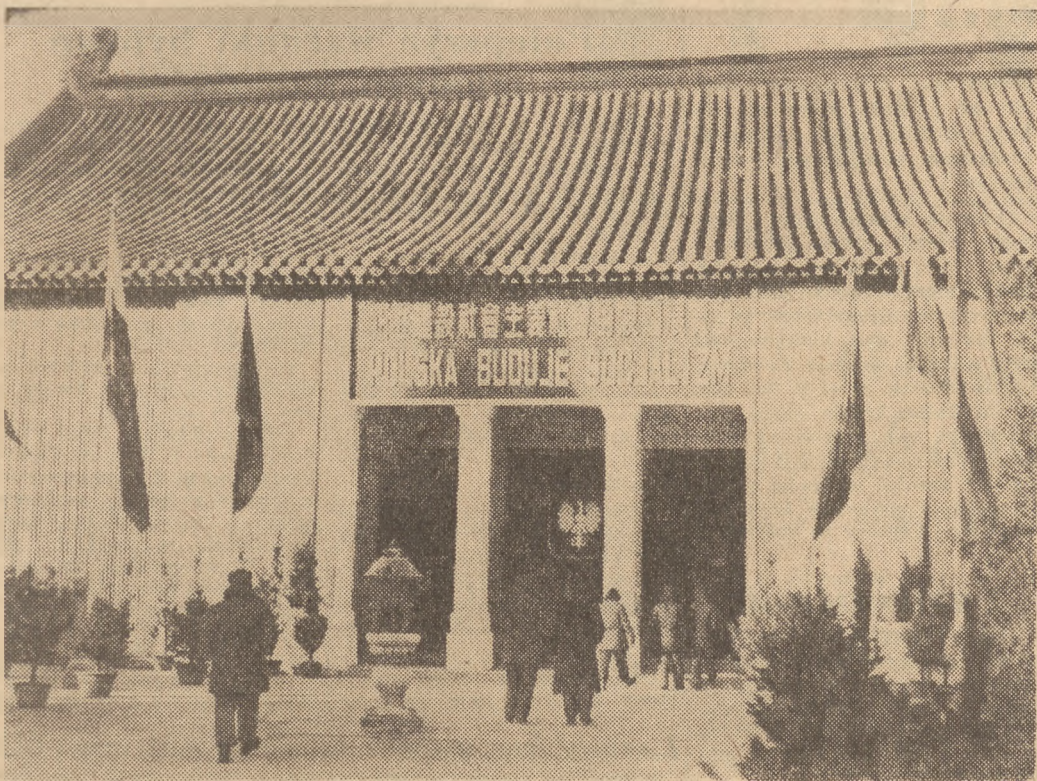
W stolicy Chin Ludowych dużym powodzeniem cieszy się wystawa pt. „Polska buduje socjalizm”. Na zdjęciu wejście na wystawę.