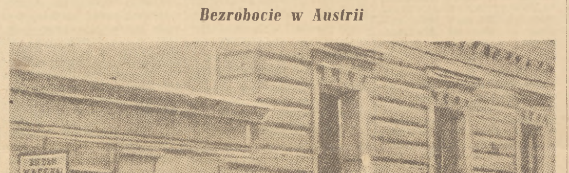
W ciągu 4 lat panoszenia się wielkorządów planu Marshalla w Austrii, ilość bezrobotnych...