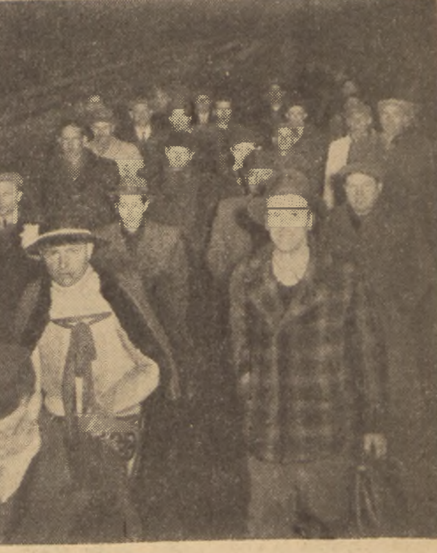
Delegacja z województwa krakowskiego na Duńcu Głównym w Warszawie.