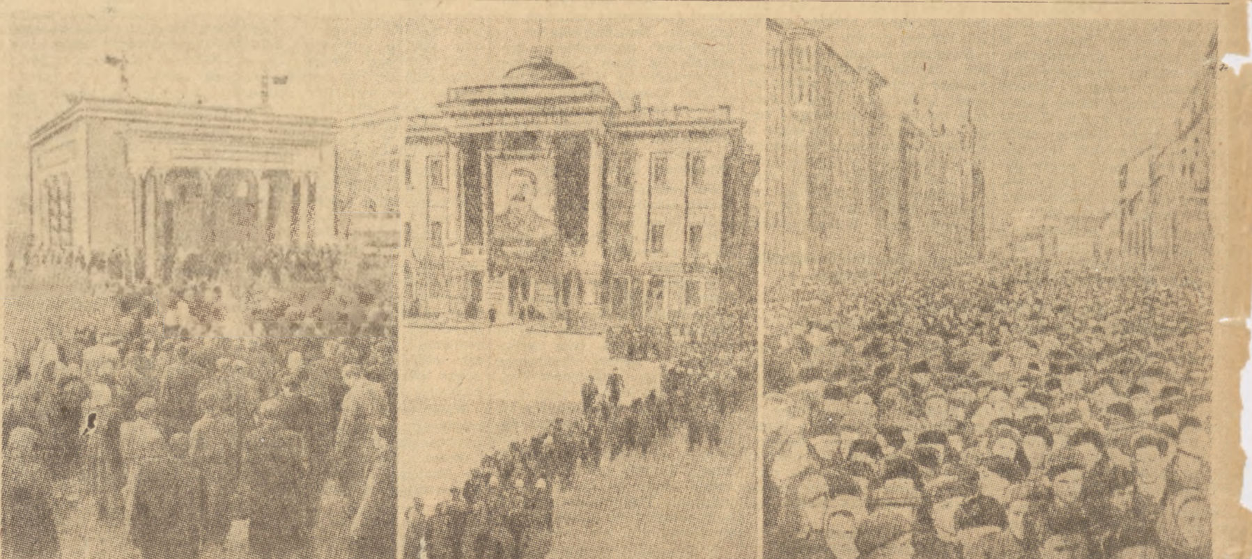
W dni żałoby. 1. Gori, 6 marca 1953 roku. Przed domem, w którym urodził się Towarzysz Józef Wissarionowicz Stalin. 2. Moskwa, Dom Związków. 3. Na ulicy Gorkiego w Moskwie. Tłumy ludności pracującej zdążają do Domu Związków

Naród polski, polski lud pracujący, który swoją niepodległość i wyzwolenie z jarzma kapitalizmu zawdzięcza Stalinowi, stalinowskiej polityce KPZR, jeszcze ścisłe zwiernia szeregi wokół wielkiego narodu radzieckiego, wokół wykutej przez Lenina i Stalina Komunistycznej Partii Związku Radzieckiego, wokół jej stalinowskiego kierownictwa — w walce o pokój i wolność, w walce o urzeczywistnienie nieśmiertelnego ideału Marksa - Engelsa - Lenina - Stalina, i komunizmu.