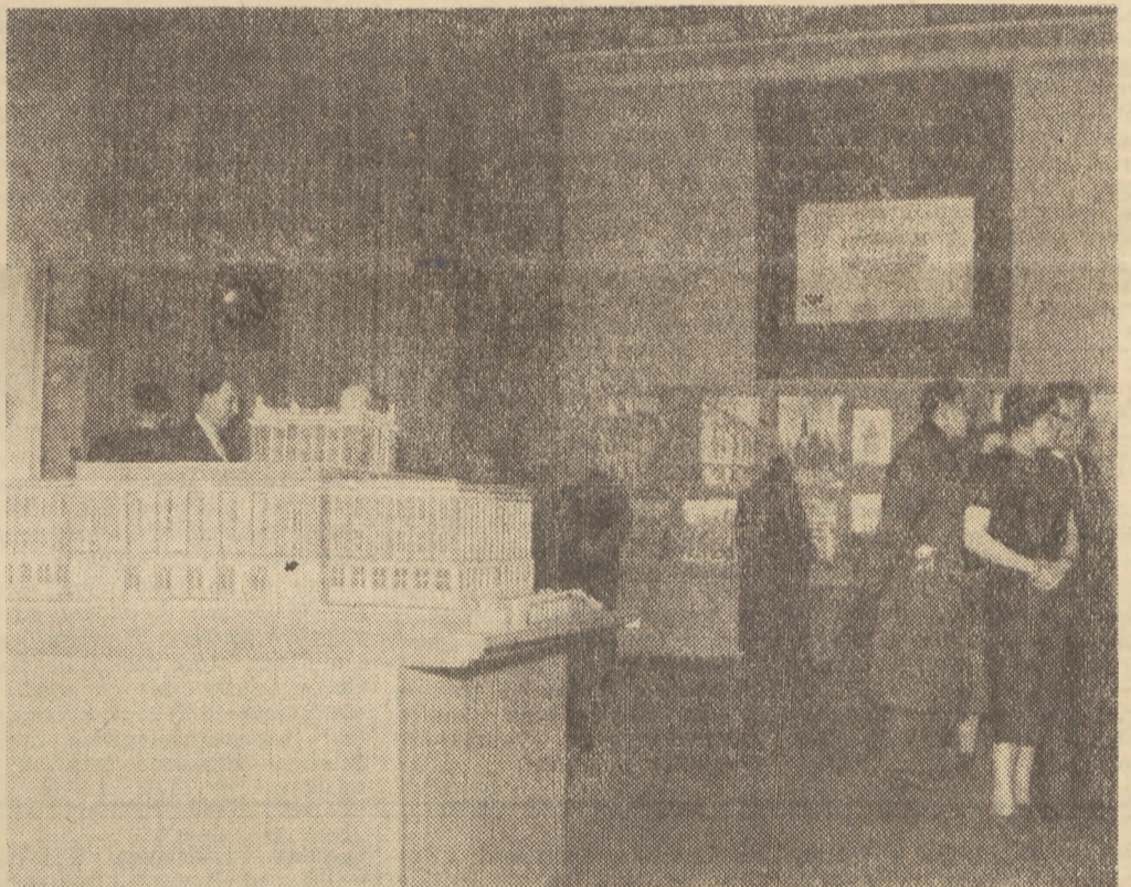
W Warszawie w gmachu „Zachęty” przy pl. Małachowskiego otwarto niedawno Pierwszą Państwową Wystawę Architektury Polski Ludowej...