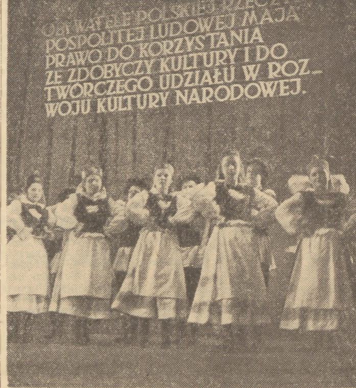
Dnia 26 III, 1953 r. w Chorzowie, zakończyły się...