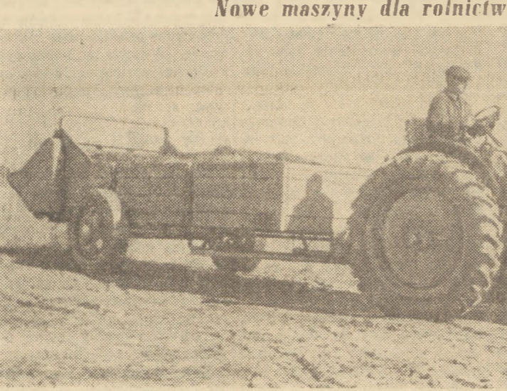
W Instytucji Mechanizacji i Elektryfikacji Rolnictwa skonstruowano mechaniczny rozrząsacz obornika, który weździe w br. do produkcji. Rozrząsacz ten zaoferowano około 70 procent pracy ludzkiej. Dankowanie obornika może odbywać się za pomocą rozrząsacza - w zależności od potrzeby - 10 do 40 ton na ha.