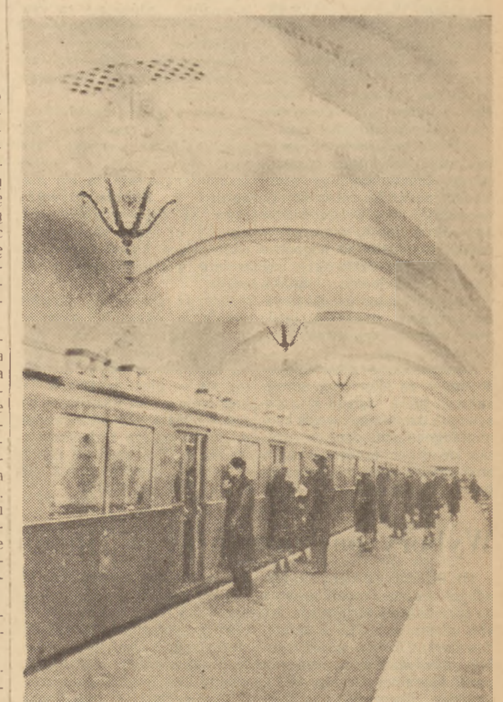
Jak już podawaliśmy — w Moskwie oddany został do użytku nowy odcinek metra z trzema stacjami: „Arbatskaja”, „Siniolenskaja” i „Kijowskaja”. Na zdjęciu: peron nowej stacji „Arbatskaja”.