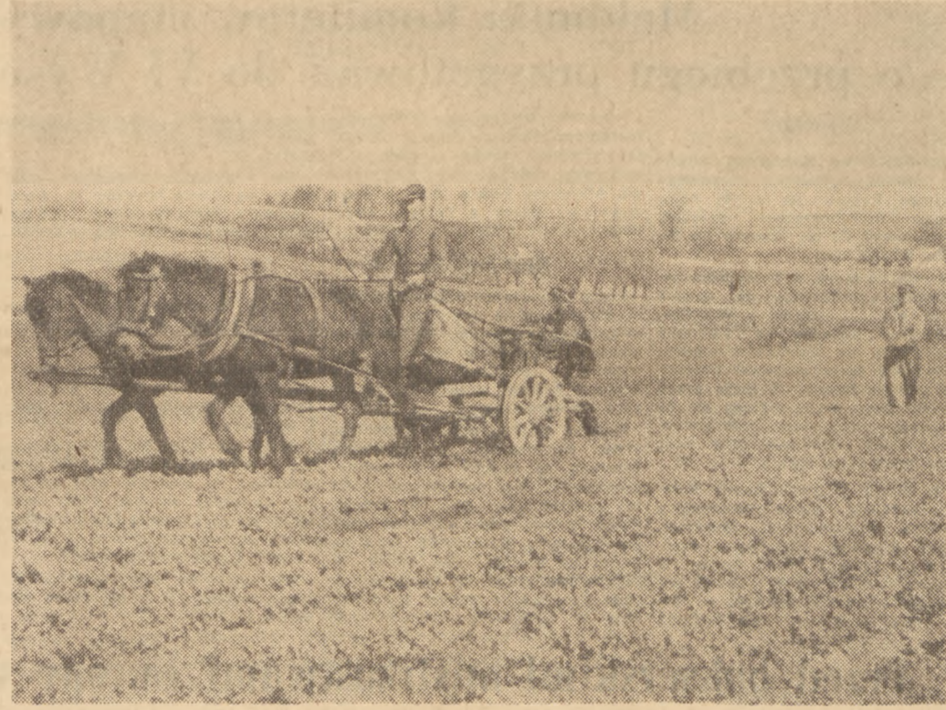
Gospodarstwo PGR Łazany (pow. Kraków) chcą uchronić pięknie zapowiadający się rzepak przed groźnym szkodnikiem, przystąpiło do spryskiwania pola azotoksem.