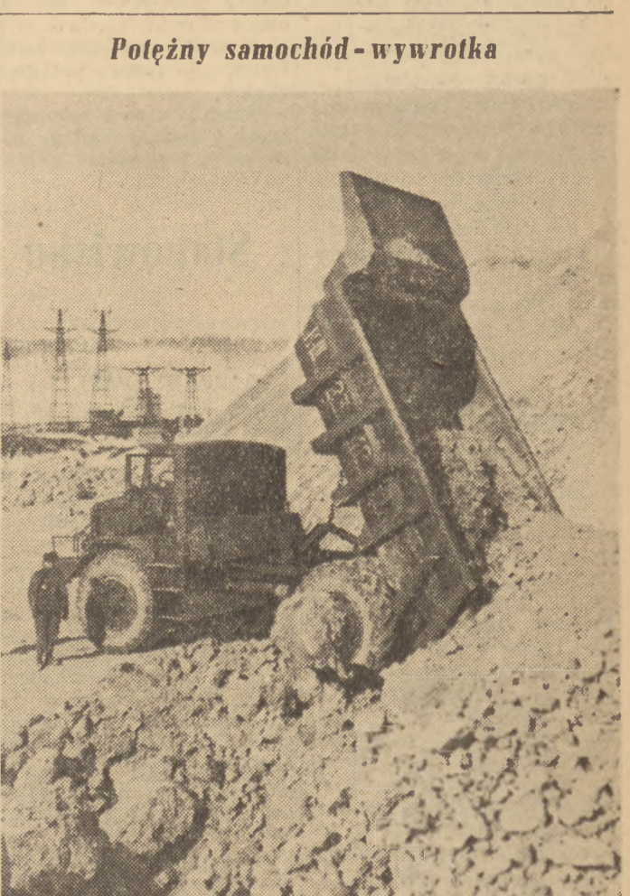
Potężny samochód-wywrotka Przy przewożeniu ziemi na budowie Kufyszewskiej, elektrycznej wodnej wykorzystywane są różne typy samochodów-wywrotek, wśród nich szerokie zastosowanie mają potężne 25-tonowe wywrotki produkowane przez Zakłady Samochodowe w Mińsku. Na zdjęciu: 25-tonowy samochód-wywrotka w czasie wyładunku ziemi.

Cały naród polski, zdając sobie sprawę z wagi pokojowego rozwiązania problemu niemieckiego, z uwagą śledzić będzie przebieg rozprawiającej się konferencji w głęokim przeświadczeniu, że wyniki jej przyczynią się do umocnienia walki przeciwko remilitaryzacji, przeciw odbudowie Wehrmachtu pod szyldem „armii europejskiej”, przeciw rewizjonistycznym zakusom na nasze ziemie, a tym samym do przyspieszenia zjednoczenia Niemiec pokojowych i demokratycznych, pragnących w przyjaźni ze swymi sąsiadami budować pokojową przyszłość Europy.