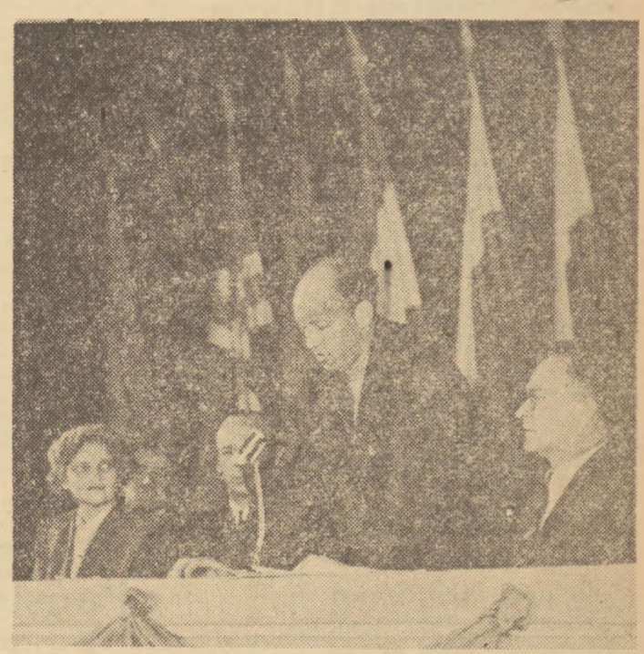
Zwycięzca VI Wyścigu Pokoju w klasyfikacji indywidualnej — Duńczyk Christian Pedersen przemawia w imieniu zawodników w czasie uroczystości rozdania nagród.