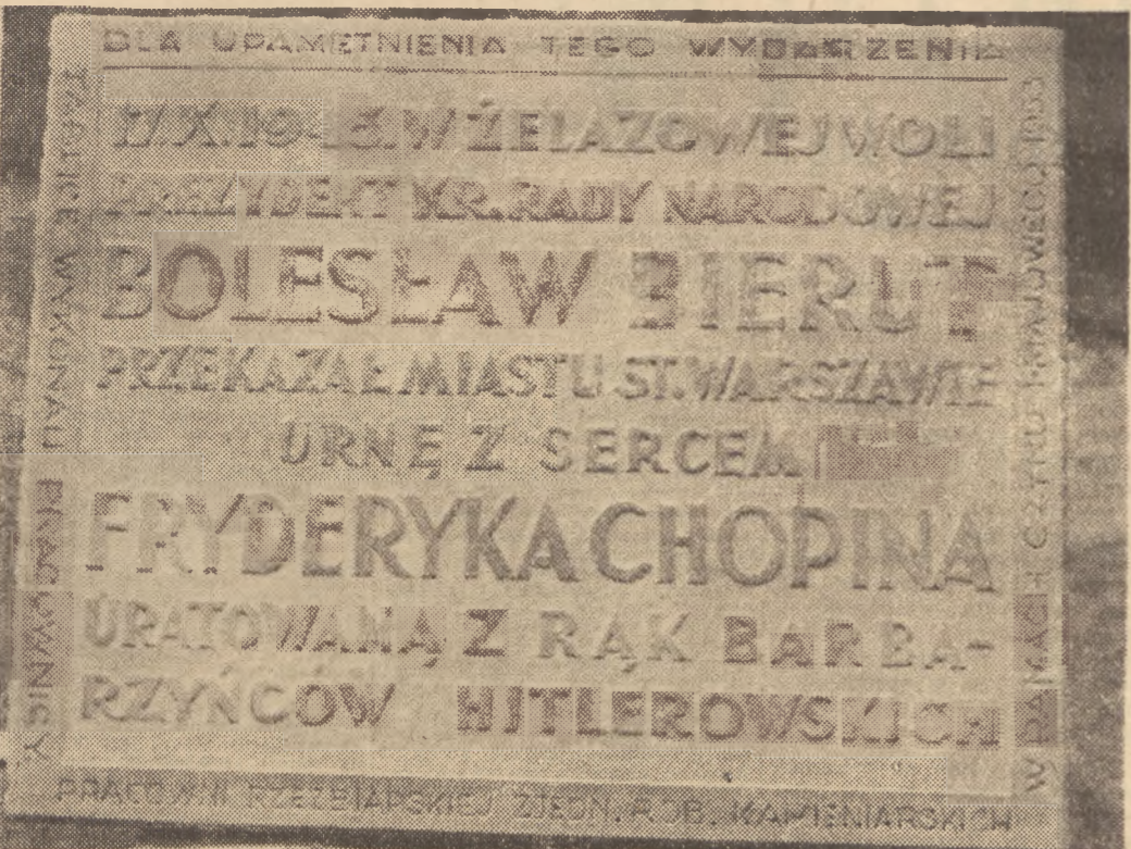
17 X 1945 r. w Żelazowej Woli Prezydent KRN Bolesław Bierut przekazał Warszawie urnę z sercem Fryderyka Chopina, uratowaną z rąk barbarzyńców hitlerowskich. Na zdjęciu: tablica pamiątkowa wykonana przez pracowników Pracowni Rzeźbiarskiej Zjedn. Robót Kamieniarskich, której odstąpienie odbyło się 17 bm.