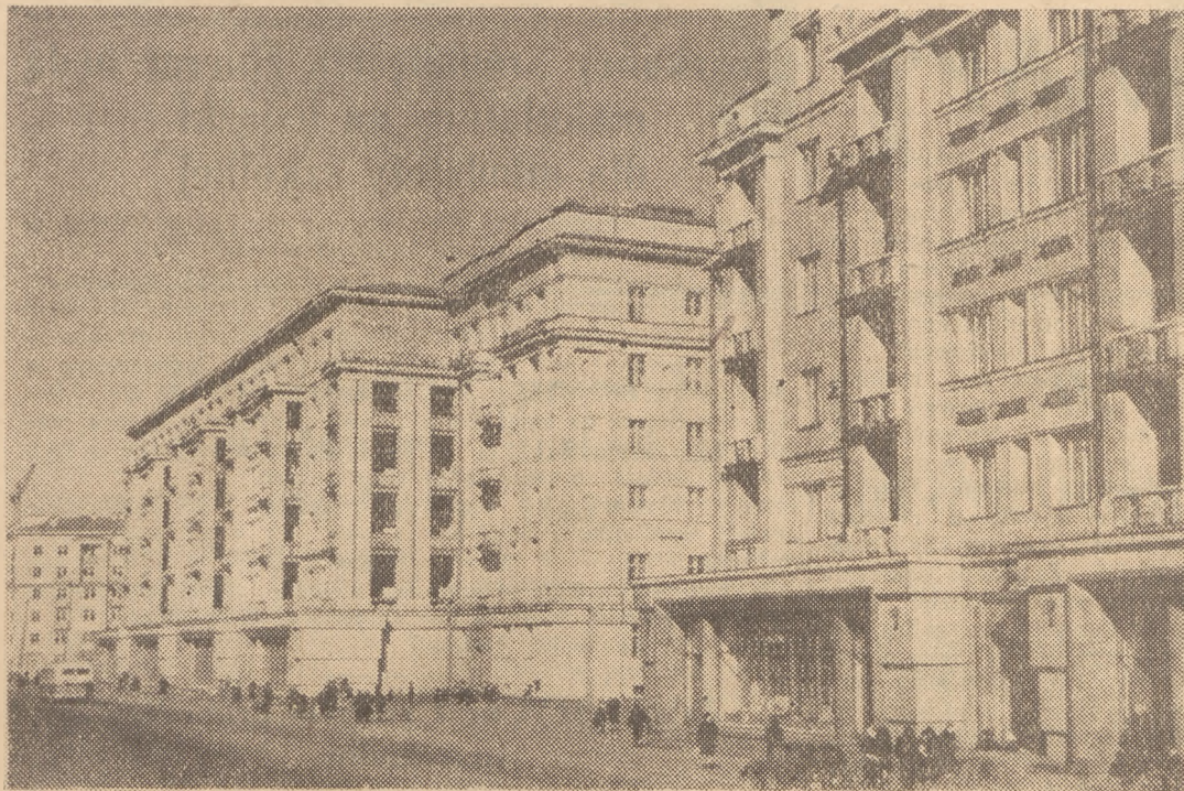
Nowe domy mieszkalne w alei im. Stalina w Leningradzie.