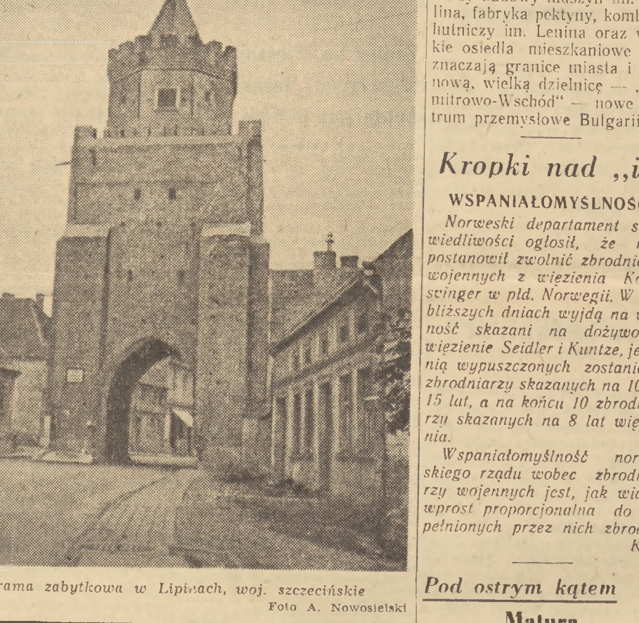
Brama zabytkowa w Lipiwo, woj. szczeciński

W Dymitrowie, niedaleko kopalni węgla znajduje się huta szkła „Krysztal”. Dawniej produkowała ona w ciągu godziny przeciętnie 45 metrów bieżących tafli szklanej określonego asortymentu i posiadała wszystkie trzy specjalne maszyny. Po rekonstrukcji i uruchomieniu czwartej maszyny, jak również przy przyswojeniu przez załogę radzieckich metod pracy, fabryka ta osiągnęła przeciętnie produkcję 80 mb. na godzinę, czyli prawie podwoiła swoją produkcję. Wydatnej pomocy udzielił załogę radzieckiej inżynier Najdenow.