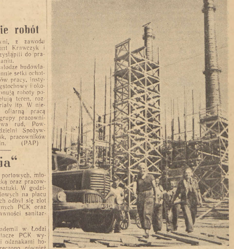
Dzieńca z brygady młodzieżowej Czesławy Nowak potrafią nie tylko dobrze pracować. Schodząc z budowy kokosowni, chociaż na pewno zmęczone, śmieją się wesoło. Nie dziwne: poczucie sumienia wykonanego zadania dodaje radości i uśmiechu. Przyjemny i zasłużony będzie odpoczynek.