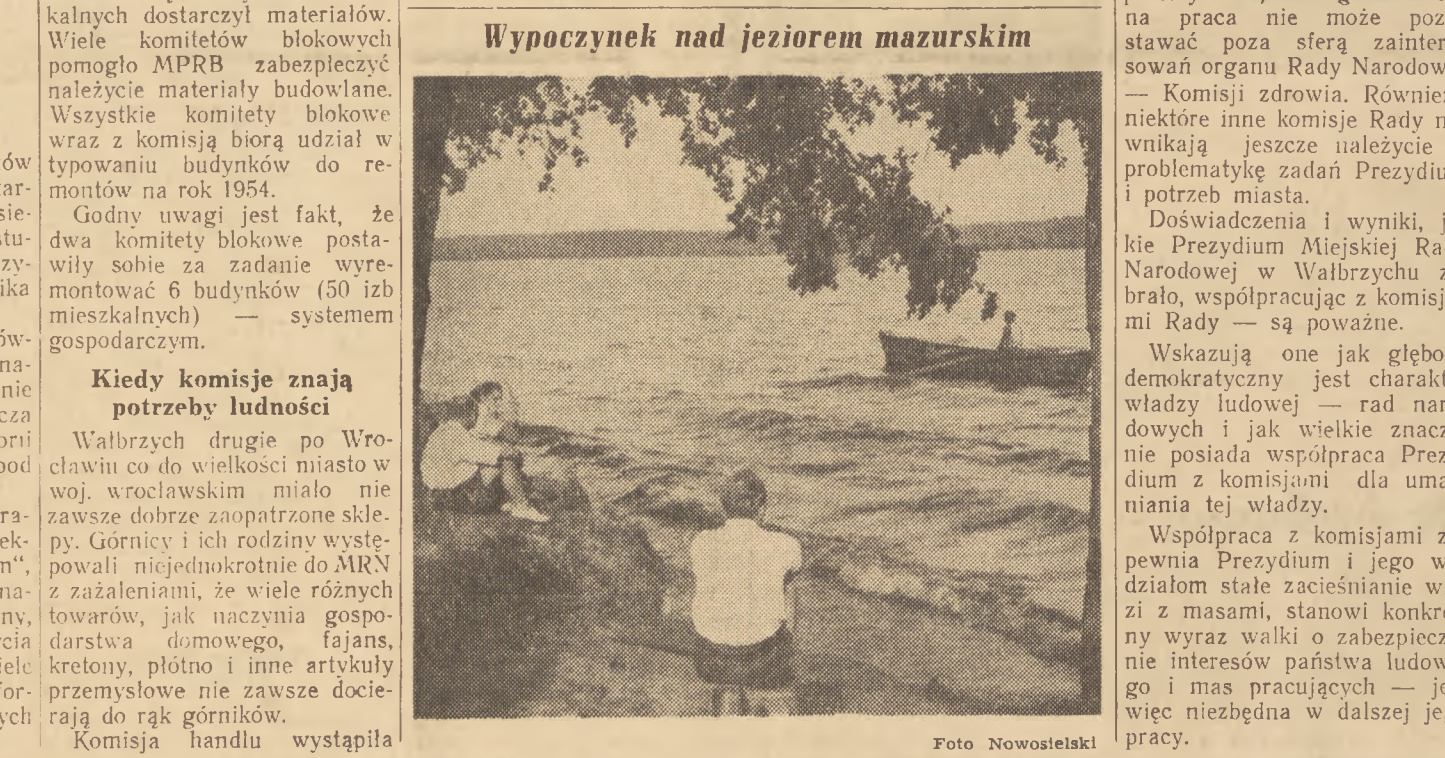
Wypoczynek nad jeziorem mazurskim.