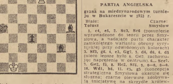
Białe zaczynają i remisują. Zadanie „B” Nr 64

Zadanie „A” Nr 64 F. J. Prokop, „Szachmatny” List. 1927 r.