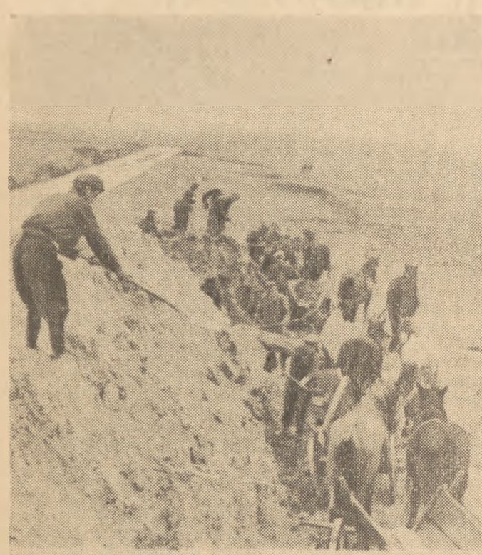
Bagna Biebrzańskie zajmują obszar 200 tys. ha, z czego na bagna Kuwasy przypada 7 tys. ha.

Od odwodnienia bagien rozpoczyna się wielka akcja melioracji, w której wyniku 200.000 ha bagien zamieni się w wysoko wydajne łąki, pastwiska i żyzne grunty orne.