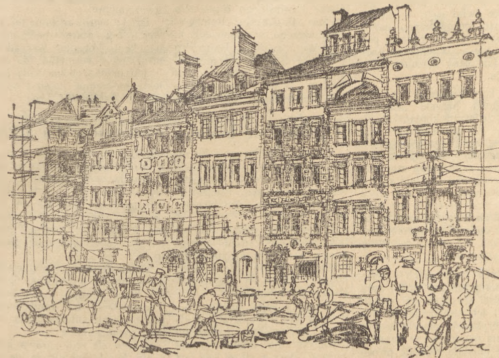
Jako pierwsza została odsłonięta na Rynku Starego Miasta strona Dekerta. Wśród białych kamieni wybrzydza się tam pięknymi złoconymi kamieniczkami „Pod Murzynkiem”, w której znajduje się Muzeum Historyczne.

WARSZAWA (Obsl. wt.). Wczoraj zdołano ruszowania z dalszej kamieniczki po stronie Barssa. Odsłonięto również kamieniczkę na rogu Zapiecka i Rynku po stronie Zakrzewskiego.