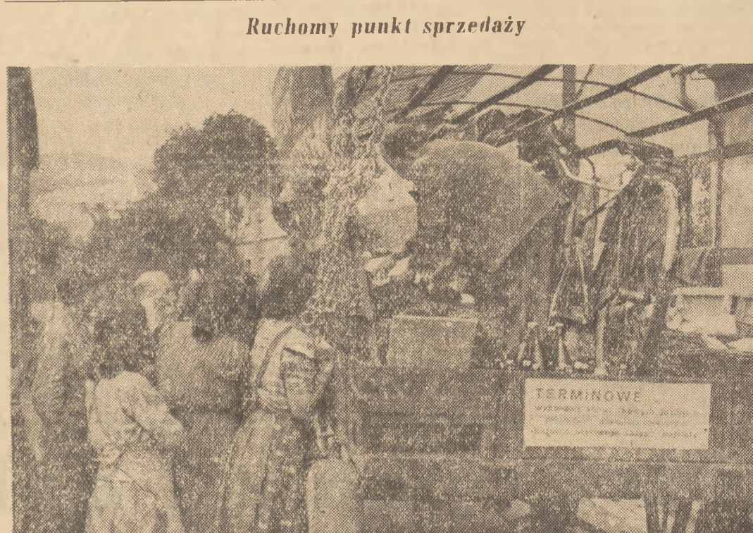
Gminna spółdzielnia Samopomocy Chłopskiej w Starych Bogaczewicach (pow. Watorzyn) zorganizowała w okresie żniw ruchomy punkt sprzedaży...