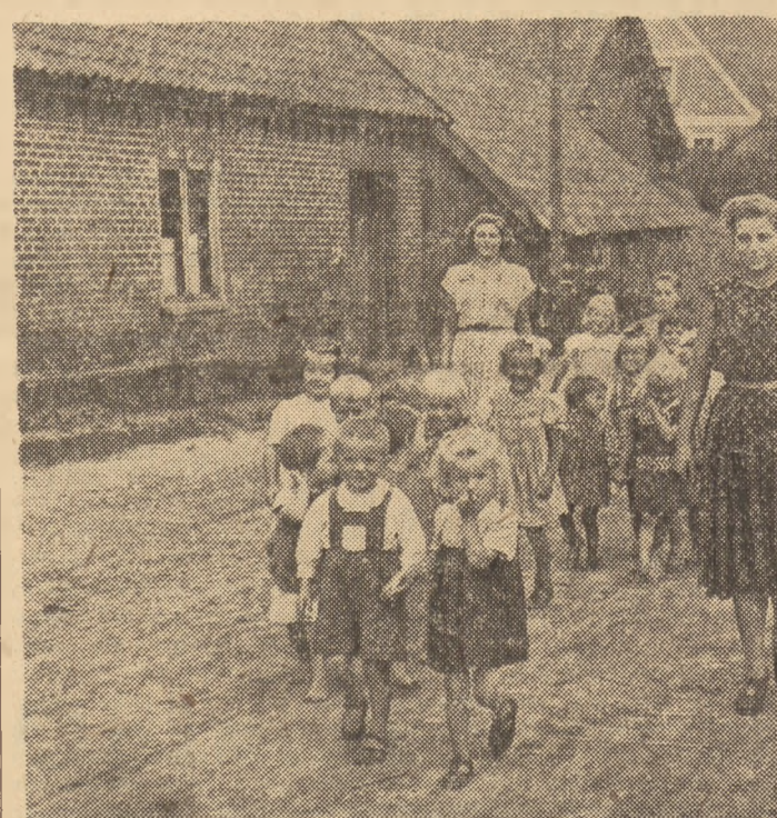
W czasie, gdy matki zajęte są pracą w polu, dzieci ze spółdzielni produkcyjnej im. Marszałka Rokossovskiego w Brusinach, pow. Susz znajdują fachową opiekę w przedszkolu...