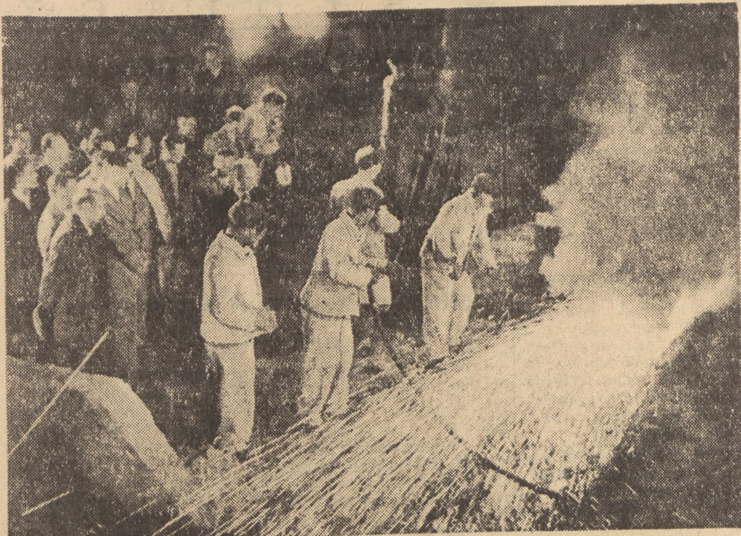
1 sierpnia 1953 weszli w służbę gospodarstwu narodowej pierwszej wielki piec w hucie im. Bolesława Bieruta w Częstochowie. Na zdjęciu: pierwszy spust surówki.