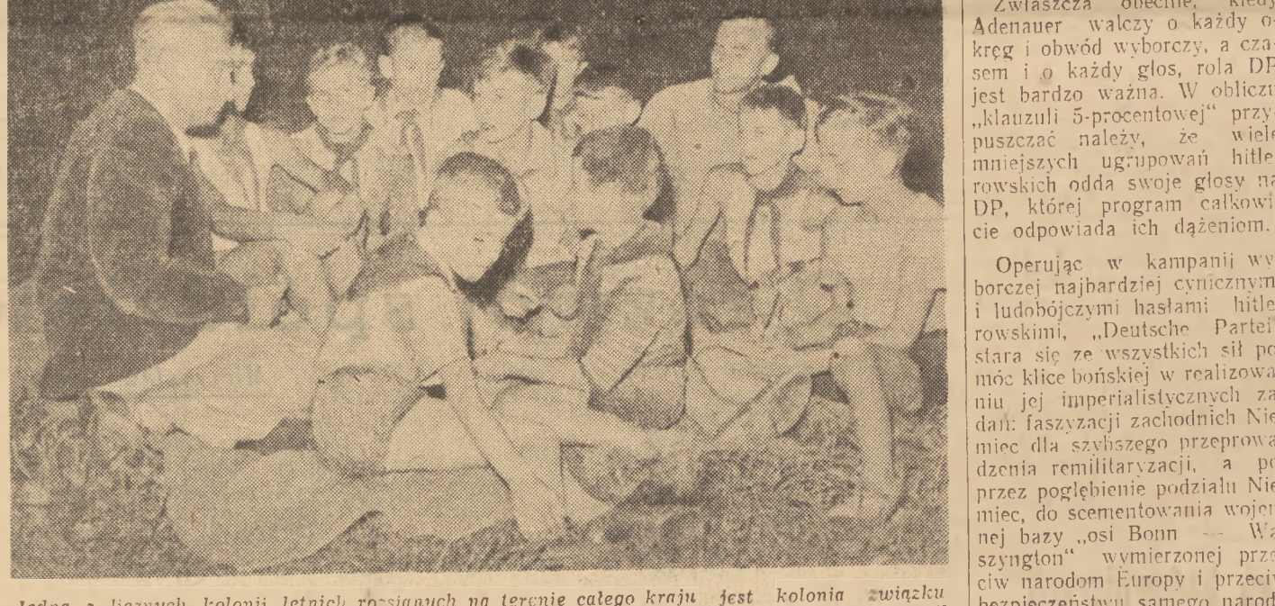
Jedną z licznych kolonii letnich rosnących na terenie całego kraju jest kolonia związków metalowców w Ochocimiu Dolnym. 172 chłopcy nabiera w niej siły i zdrowia. Samorząd chłopcy jest duża pomocą w pracy kierownictwa. Na zdjęciu kierownicy kolonii i samorząd omawiają plan zajęć na najbliższe dni.