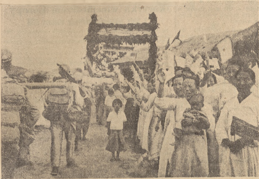
Kobiety i dzieci koreańskie pozdrawiają ochotników chińskich, którzy opuszczają strefę demilitaryzowaną po podpisaniu rozejmu