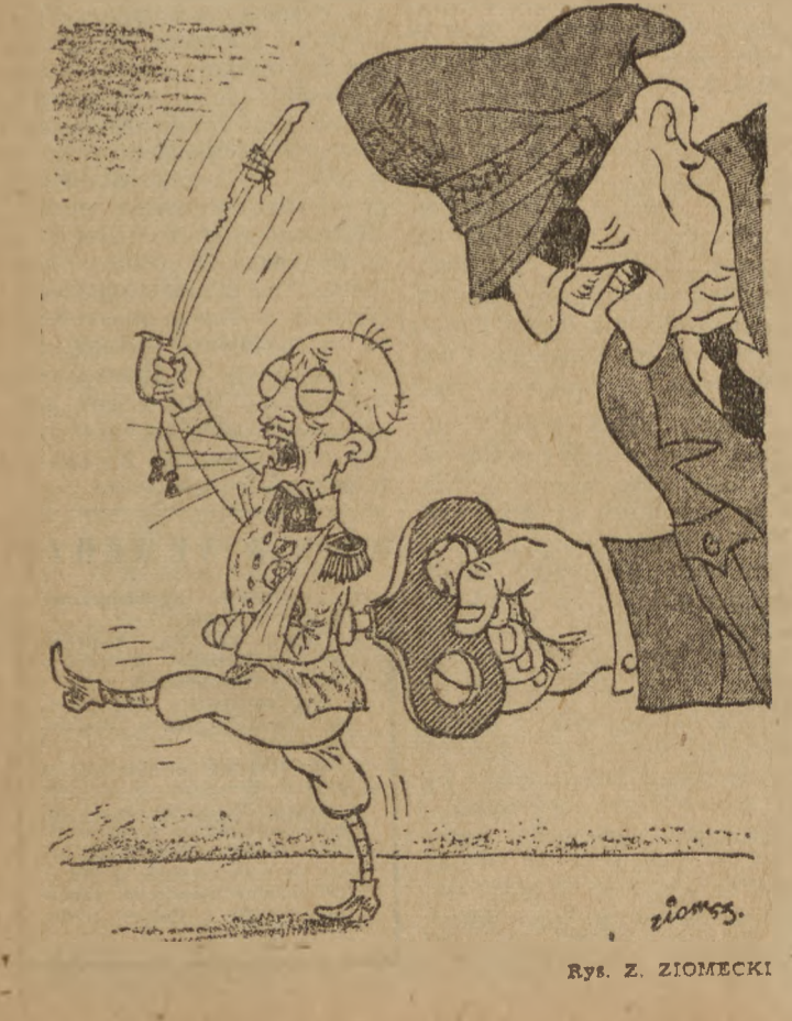
rys. Z. ZIOMECKI