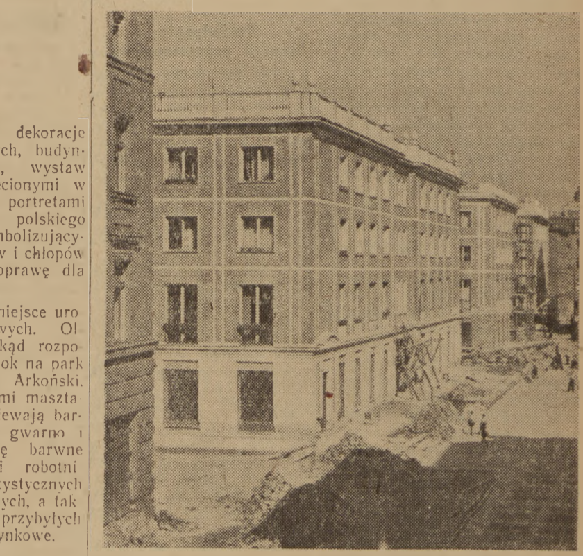
Na zapleczu ulicy Nowy Świat w Warszawie prowadzone są prace wykonywane na nowym osiedlu mieszkaniowym Nowy Świat „Wschód”