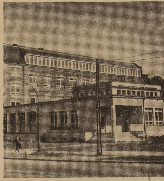
Przy miejskim szpitalu im. Kopernika w Gdańsku oddano do użytku nową klinikę dziecięcą.

stowe Przedsiębiorstwo Handlu i Usług „Uzdrowiska”, które w myśl założenia powinno uzupełniać usługi istniejącej w uzdrowiskach i miejscowościach wczasowych — normalnej sieci handlowej.