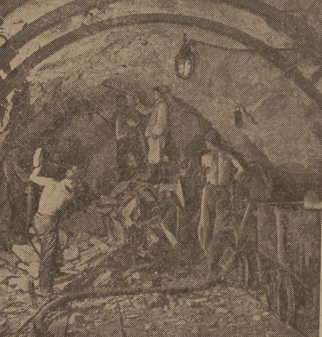
Jedną z wielu przebudowywanych i modernizowanych kopalni jest kopalnia „Nowy Wirek“ w Kocłowie. Kopalnia zostanie całkowicie zmechanizowana i zelektryfikowana. Na zdjęciu: prace w głównym przekopie. Przekop prowadzi przodująca brгада Pawła Labrynta osiągnąca 192 proc. normy.

Cena pojedynczego numeru wynosi 3,50 zł, prenumerata kwartalna — 10,50 zł. (PAP)