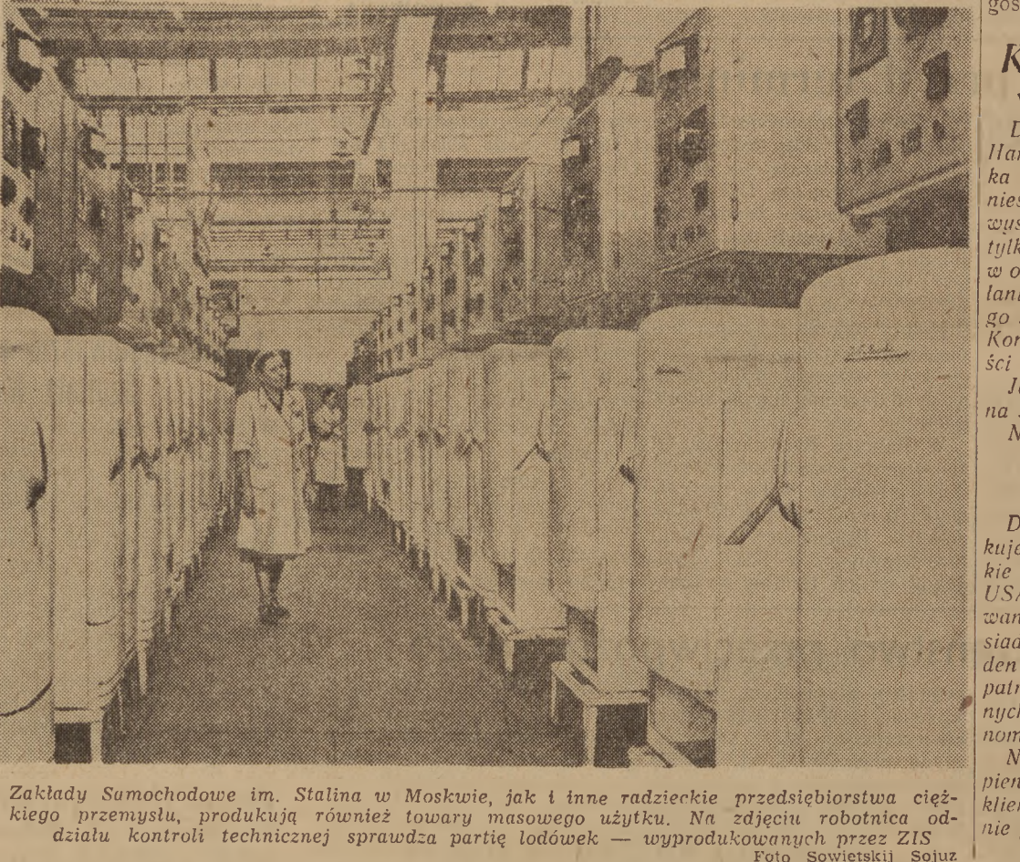
Zakłady Samochodowe im. Stalina w Moskwie, jak i inne radzieckie przedsiębiorstwa ciężkiego przemysłu, produkują również towary masowego użytku. Na zdjęciu: robotnica oddziału kontroli technicznej sprawdza partię lodówek — wyprodukowanych przez ZIS.