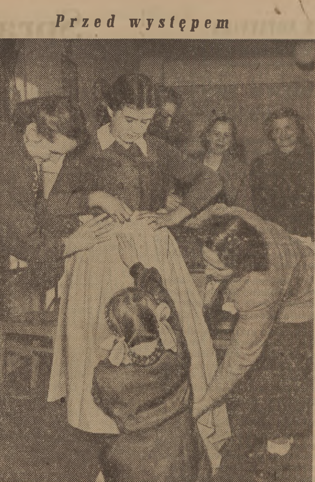
Przed występem. Dzieci szkoły TPD w Dabrowie Borze k/Kraśnika przygotowują na zakończenie Miesiąca pogłębień przyjaźni polsko-radzieckiej występ pieśni i tańca radzieckiego. Na zdjęciu: matki i nauczycielki przymerają dzieciom stroje do występu.

Układ ten nie tylko nie przyniesie poprawy sytuacji ekonomicznej, lecz ją pogorszy. Dowodem tego jest uchwała rządu ateńskiego, opublikowana dwa dni po podpisaniu układu, „o umożliwieniu inwestycji kapitałów obcych w kraju”, w myśl której obce kapitały będą m. in. w ciągu 10 lat zwolnione z cel, podatków, wszelkiego rodzaju opłat. Słusznie więc „Daily Worker” pisał w związku z tym układem: „W ciągu 72 godzin Grecja straciła ostatnie resztki swej ekonomicznej i politycznej niezawisłości”.