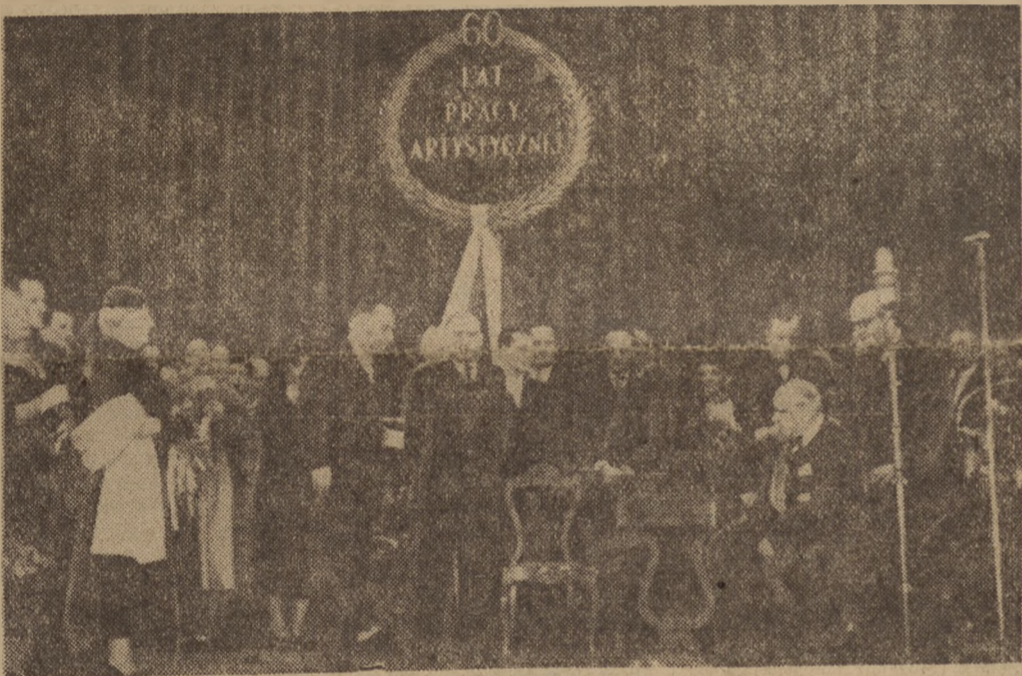
W dniu 16.II br., znany aktor polski, Aleksander Zelwerowicz, obchodził 60 rocznicę swej pracy artystycznej i 36-lecie pracy pedagogicznej. Na zdjęciu: Aleksander Zelwerowicz w otoczeniu aktorów.