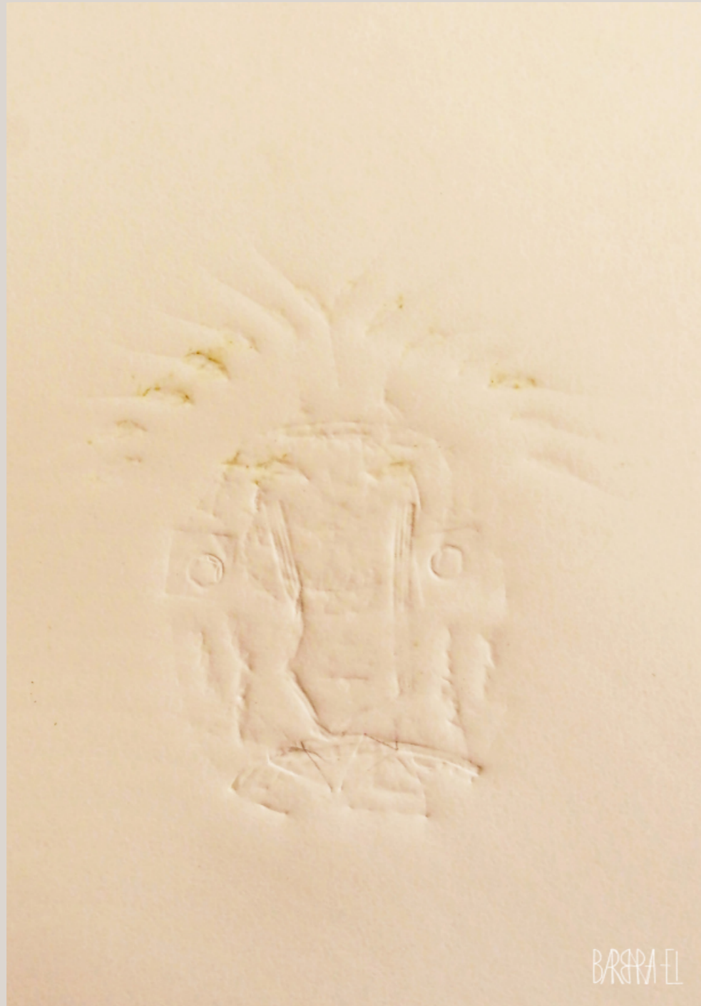
Totem 004 | Fossil 0023 | Relief | Barbara El / Leszczyńska