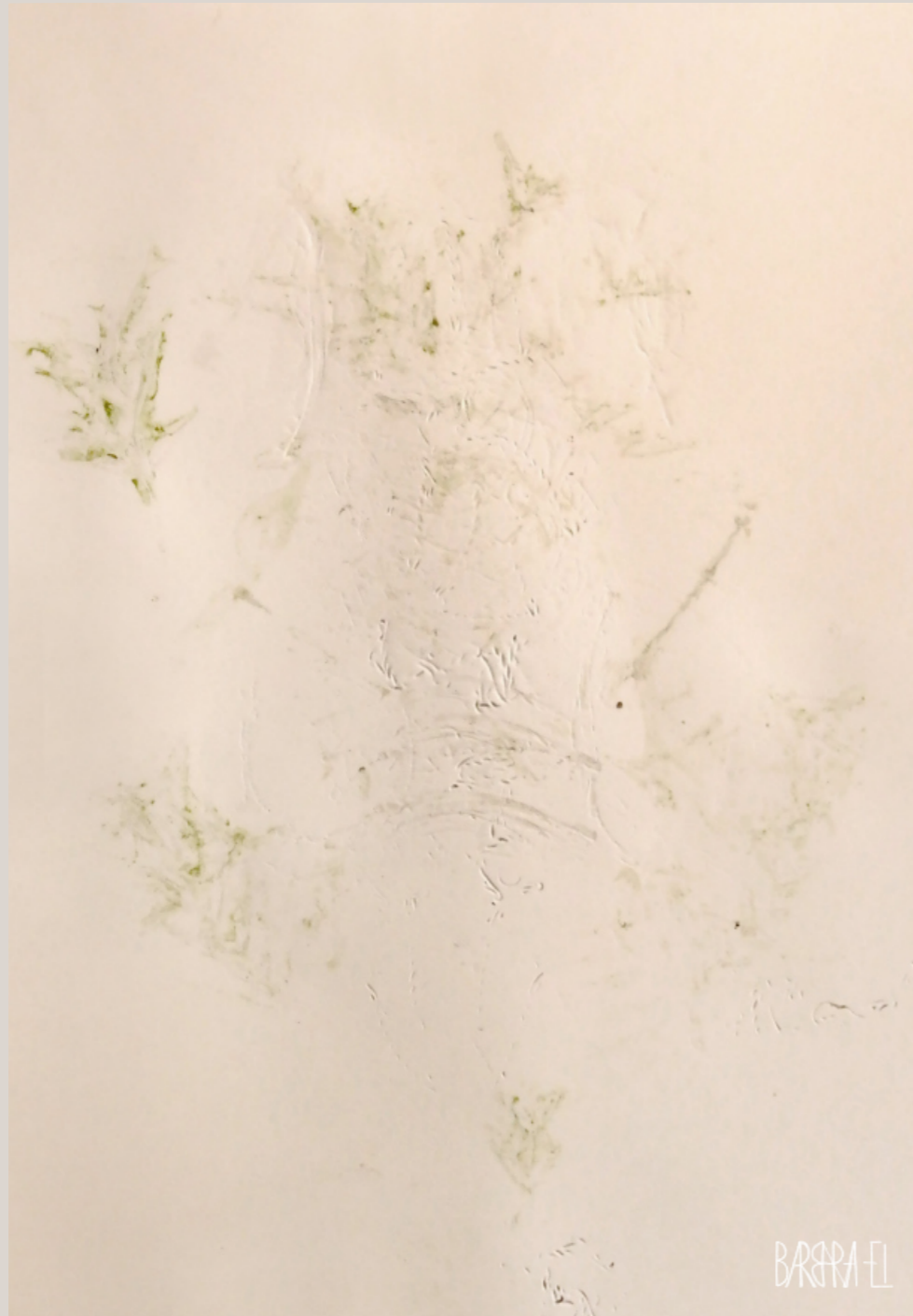
Homo metallicus 005 | Fossil 0044 | Relief | Barbara El / Leszczyńska