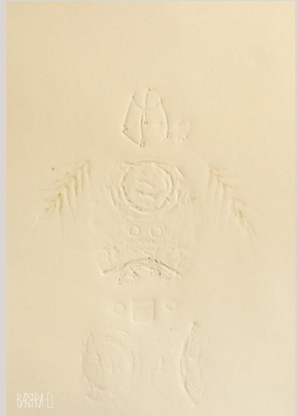
Homo metallicus 002 | Fossil 0041 | Relief | Barbara EI / Leszczyńska