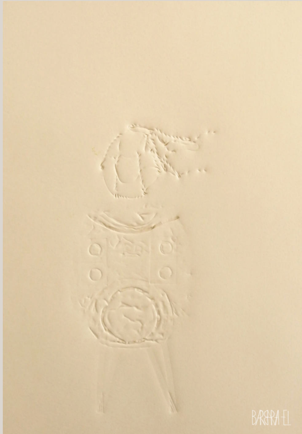
Homo metallicus 001 | Fossil 0040 | Relief | Barbara EI / Leszczyńska