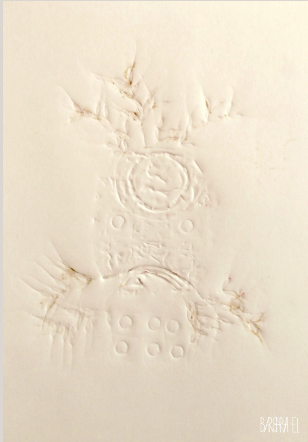
Totem 002 / Fossil 0021 | Relief | Barbara El / Leszczyńska