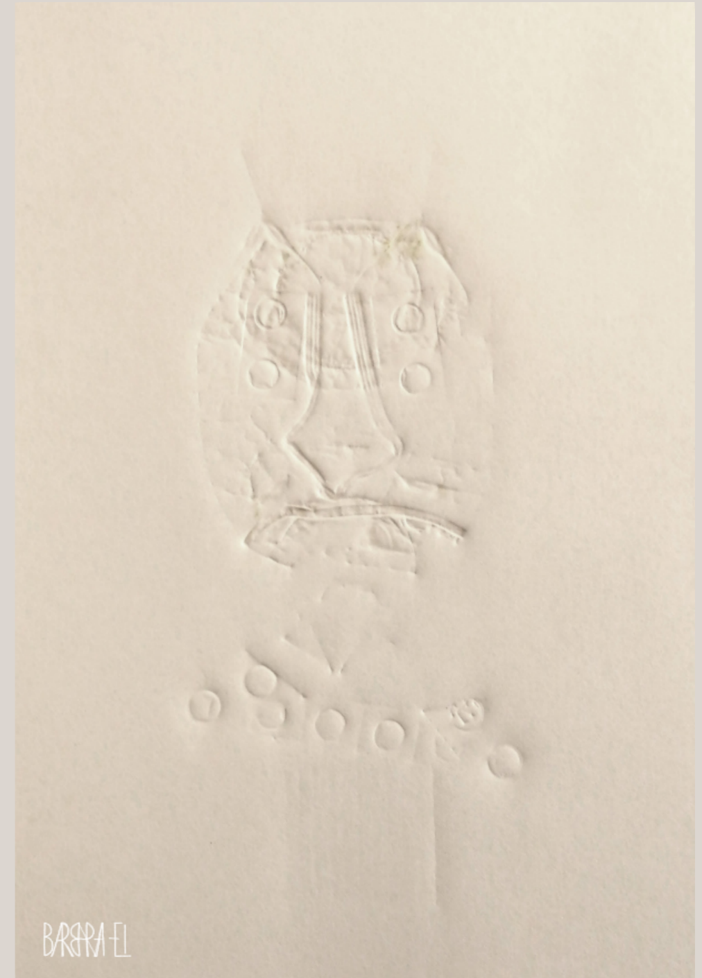
Totem 003 / Fossil 0022 | Relief | Barbara El / Leszczyńska