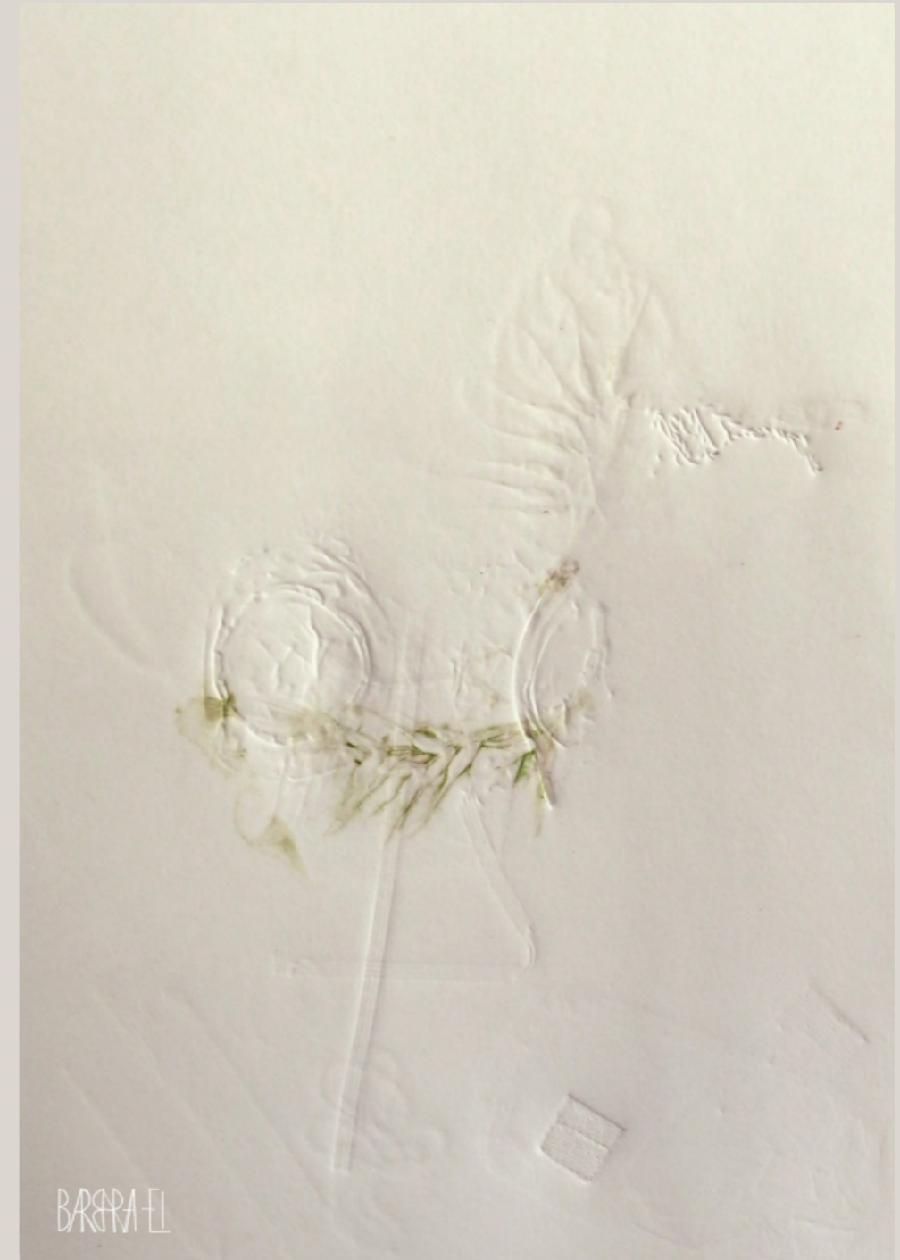
Metallicus | Animalis 001 | Fossil 0050 | Relief | Barbara El / Leszczyńska