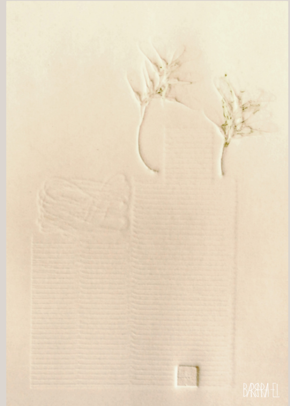
Tracesofagglomeration002 | Fossil0031 | Relief | BarbaraEI/Leszczyńska