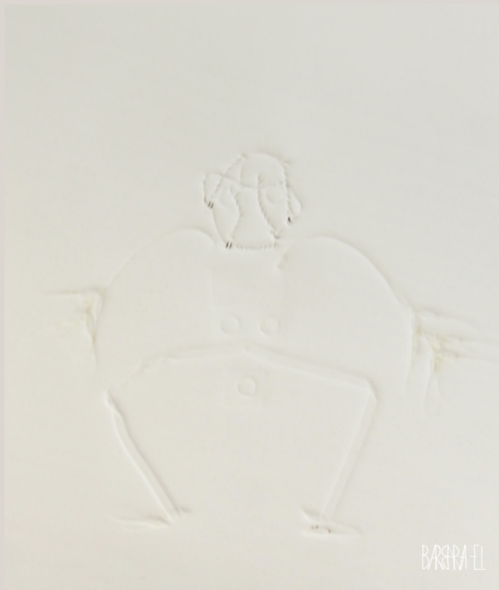
Homo metallicus 004 | Fossil 0043 | Relief | Barbara El / Leszczyńska