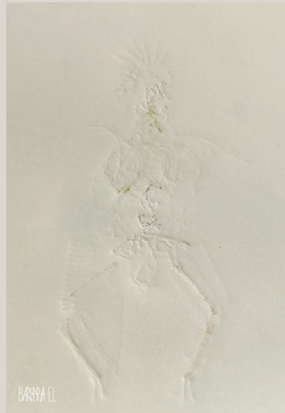
Homo metallicus - La Femme 003/001 | Fossil 0042 Relief | Barbara El / Leszczyńska