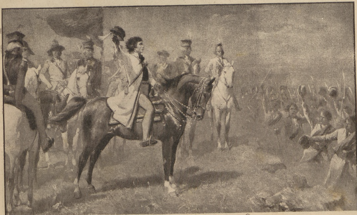
Po bitwie raclawickiej T. Kościuszko przyjmuje defiladę kosynierów.

Gdzie najczęściej ludzi pada, Tam Kościuszko leci, Porządkuje, rozkazuje: Trzymajcie się, dzieci. Madaliński z hułanami Coraz to się puści, Jak żelazo piersi stawi Przeciw tych czeluści. Wiele złego na jednego; Kościuszko spogląda: żeby chociaż trzy armaty... Tego mu się żąda. Nie pomoże, mocny Boże, Tylko tak być musi, Jak Moskala my nie zdusim, To Moskal nas zdusi. Sztandarowym rzucił słowem: By chorągwi strzegli,