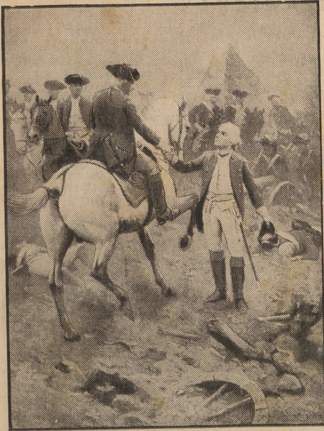
J. Waschington dziękuje T. Kościuszcze za pomoc Ameryce. Mal. F. Ajdukiewicz.

kusów i przywdziawszy na się, jako mundur, sukmanę krakowską, stał się on niejako bohaterem chłopskim. Zaroiło się w jego wojsku od białych, wyszywanych kierezyj, brzęczących pasów mosiężnych, czerwonych rogatywek z pawimi piórkami.