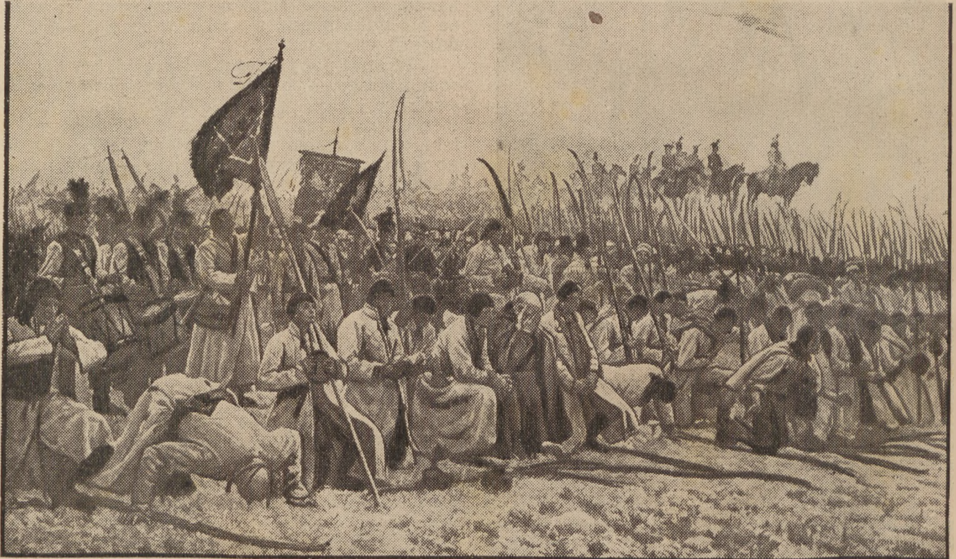
Modlitwa przed bitwą racławicką.

Na czerwonej wyrobiony Złoty snopek z kosą; A na białej srebrnej całej, Czystym złotem dziana Matka Boża niebios Pana Stawia na kolana. I głos bieży na wiatr świeży W oddaloną stronę: Jak łązka dziecka, pieśń nieświecka: „Pod Twoją Obronę”. Idą, idą prostą drogą, Chorągiewki warczą, Rwą się konie ku tej stronie, Wstrzymać ich nie starczą. Kosyniery, naród szczery, Choć to nie żołnierze;