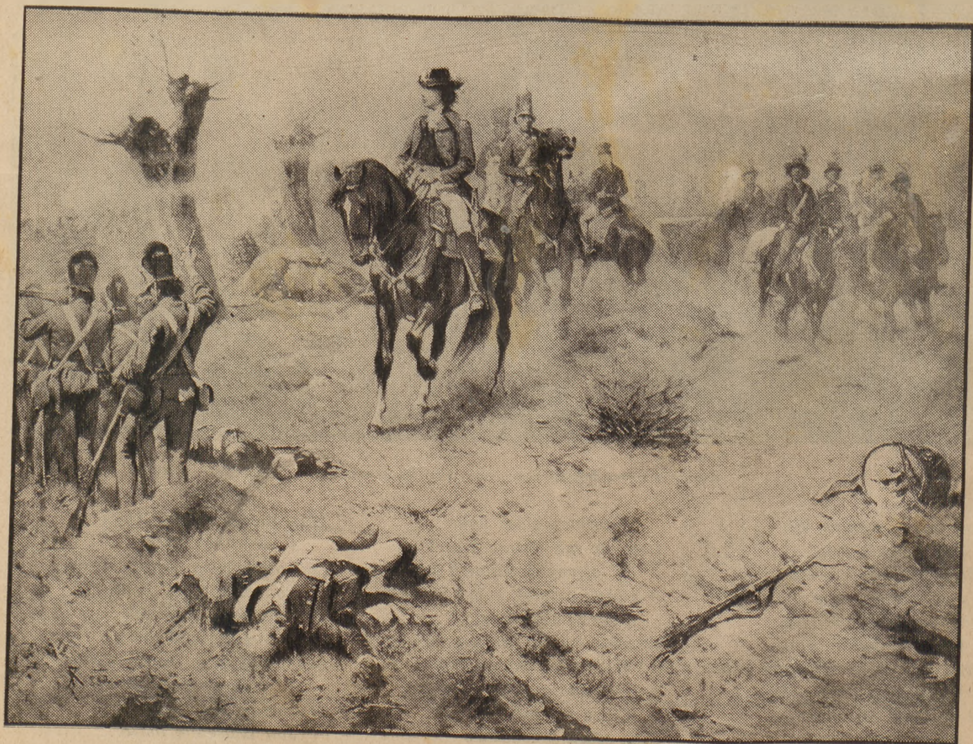
Po bitwie pod Dubienką.

W Polsce, jak i zagranicą dawniejszymi czasami, na mocy tradycją uświęconego prawa — do orężnej obrony państwa obowiązana była tylko szlachta, oraz magnaci, idący na wojnę zwykle na czele wystawianych własnym sumptem pocztów zbrojnych. Brać mieszczańska i lud wiejski zajmować się mogli tylko rzemiosłem, uprawą roli, handlem, oraz innymi pracami, złączonymi z potrzebami bytu codziennego. Olbrzymie więc siły narodu, które w dobie krytycznej mogłyby się stać dlań podporą i ratunkiem — leżały odłogiem. — Tadeusz Kościuszko, szczerzy demokrata — mały wzrostem, ale wielki duchem patriota — był pierwszym, który usiłował w czyn wprowadzić, wzniecając przez Konstytucję 3-go Maja ideę demokratyczną: uwolnić chłopów z poddaństwa, zrównać w prawach wszystkich obywateli kraju i powołać ich do służby żołnierskiej. Wezwawszy pod broń Kra-