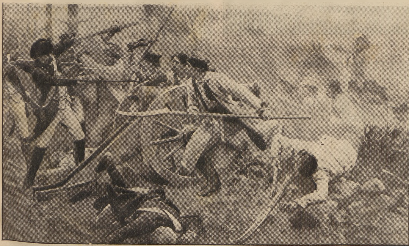
Zdobycie przez kosynierów armat pod Racławicami.