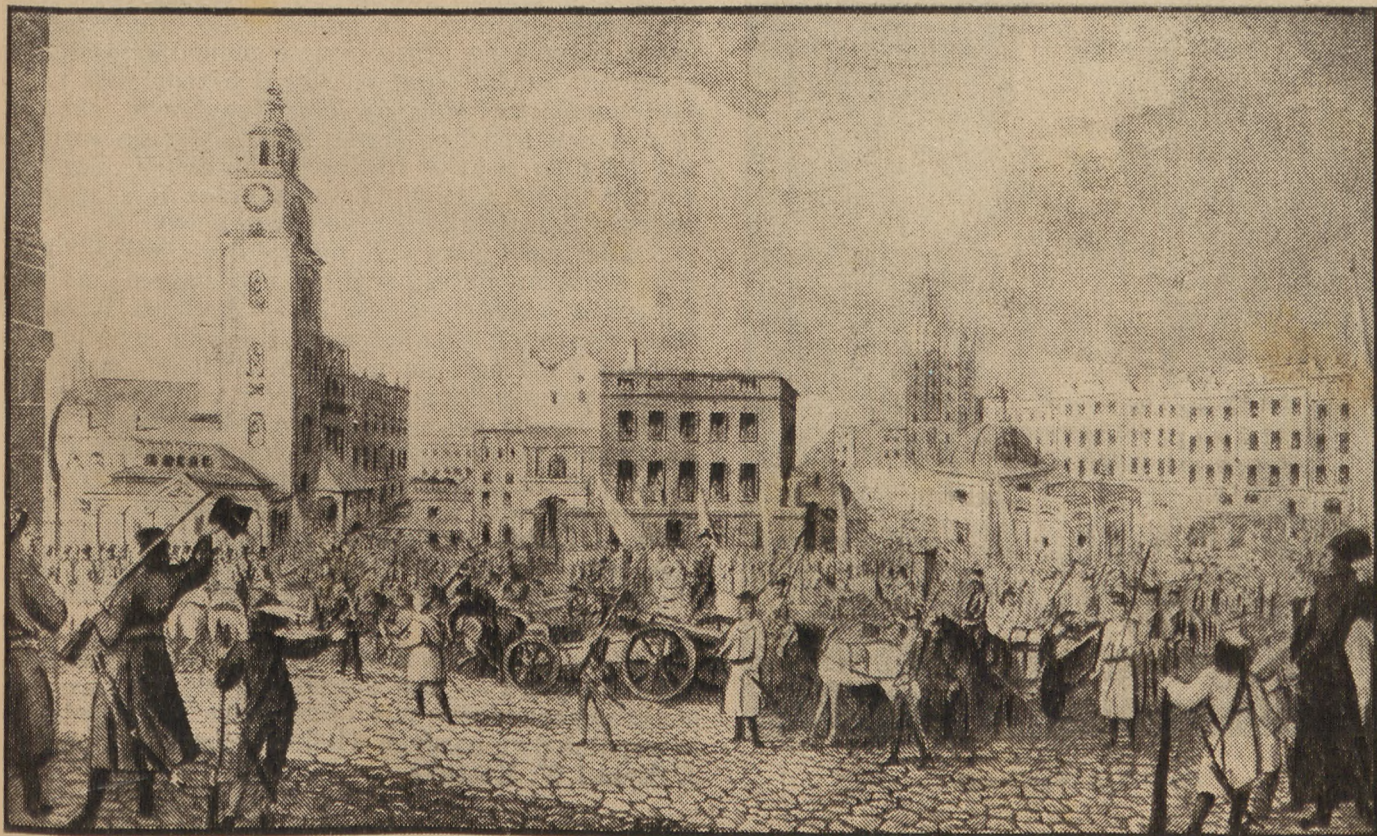
Na Ryнку Krakowskim po zwycięstwie pod Racławicami.

wzruszenie nie wysłowione. Pragnąłbym, abyś mógł być świadkiem płaczu i łkania starych i młodych, gdy Jan, lirnik, przy akompaniamencie muzyki twój precudny deklamuje ustęp. Cisza... Połykają każde słowo, łzy spływają po twarzach. Gdym na pierwszym przedstawieniu poszedł podzięko-