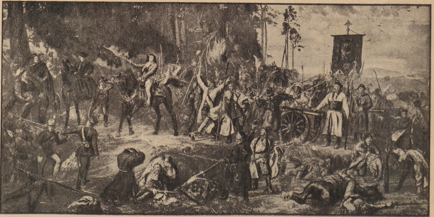
Po zwycięstwie raclawickim.