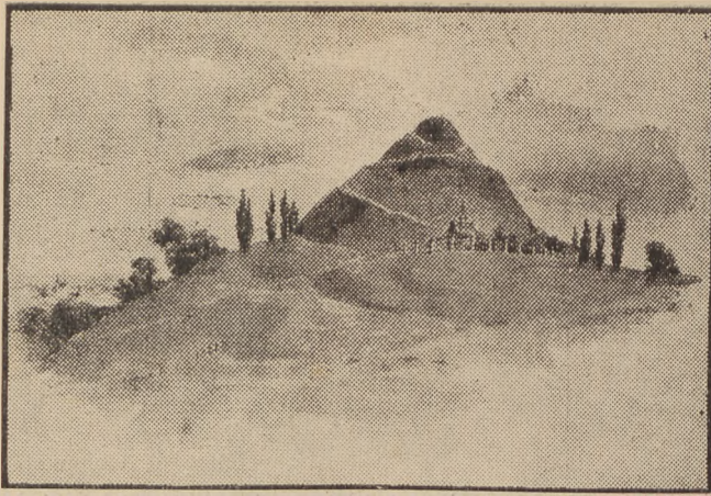
Kopiec T. Kościuszki pod Krakowem.

wać aktorowi za przesłizne wypowiedzenie tego ustępu — zastałem go ryczącego spazmatycznym płaczem i nie mogącego przyjść do siebie. O, gdybyś słyszał ze sceny potęgę własnego słowa, o gdybyś mógł widzieć te topniejące we łzach serca publiczności! Ja stary sam płakałem, jak dziecko”.