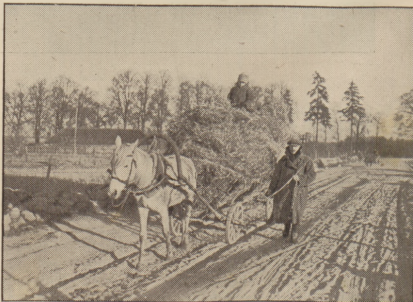
Ze ściółką z lasu.

Dzięki licznie wywożonym przetworom warzywniczym wzmógł się tej jesieni eksport polski. W tej dziedzinie zaznacza się stale wzrost naszego eksportu warzywniczego a nawet na rynkach zagranicznych zdołał zaznaczyć swą egzystencję produktami pierwszej jakości, a w kraju wzbudzić