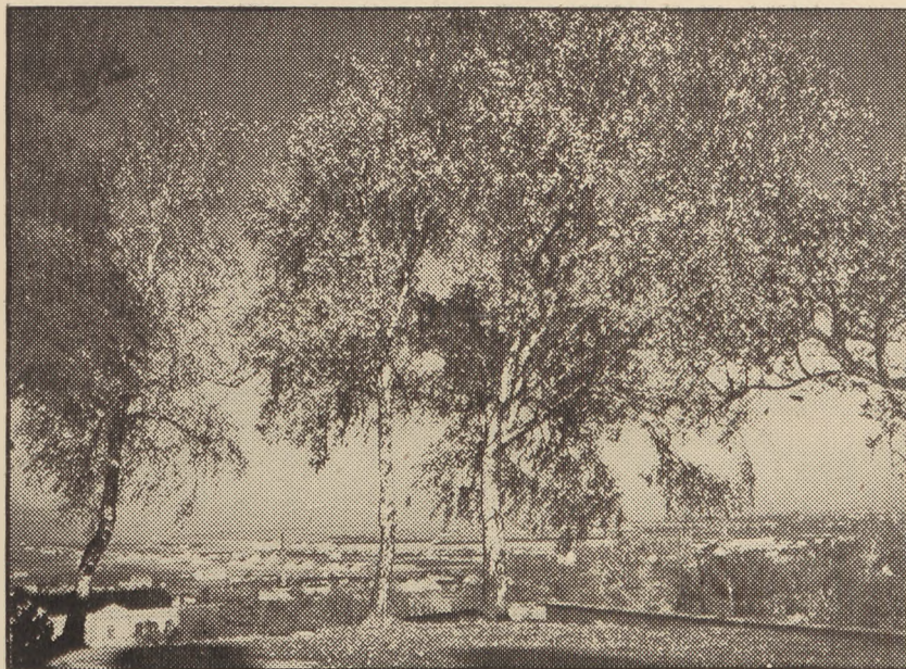
„Żółte listki brzoź dygocą, dygocą“.