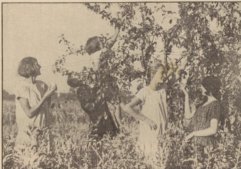
Przy zbiórce owoców.

Chłodne dni jesieni, wieczorną mgłą zasnutę wywoływać muszą tęsknotę za czymś, co minęło