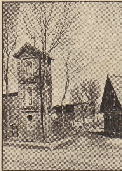
Samotna kapliczna na roku ulicy.

Wobec tych „widm jesiennych“ człowiek jest bezsilny, nigdzie się schronić nie może tak, jak przed sumieniem, w które pod wpływem takiego nastroju wgłębiamy się i zastanawiamy — co za plony będziemy zbierać, gdy lato już minęło, jak wytrwać do przyszłej wiosny. I czy to słońce złotej jesieni,