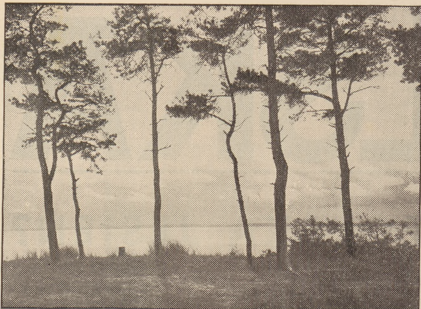
„W pożegnanie grają lasy”.

kie granatowe jagody czekają na pierwszy przymrozek. Nie słysząc gwaru ptasząt. Odleciały w cieplejsze strony. Pusto w lesie, czasem tylko można spotkać zmarznięte, szczelnie otulone chustką kobiety, które zbierają suche gałęzie—chróst—i dźwigają ten ciężar na plecach, nie czując wcale chłodu. To jedyny sposób zabezpieczenia się przed zimnem w niewielkiej drewnianej chacie. Poza tym w lesie zbiera się liście i igliwie jako ściółkę, które zwłaszcza w tym roku wskutek suszy musi zastąpić słomę na podściół. To przygotowanie na ostrzejsze dni zimy. A w głębi lasu zwierzęta rozpoczynają swe polowania — lub przygotowują swe leża zimowe. Las jesienią wabi przede wszystkim myśliwych. Rozpoczyna się sezon łowów, którym nasi przodkowie niegdyś hołowali. Zwierzy-ny było wówczas poddostatkiem, więc każdy mógł łowić, ponieważ zwierzyna była niczyja. W łowach zamięłowanie miało wielu królów polskich od Bolesława Chrobrego, wielkiego myśliwego, aż po Stanisława Augusta, który w poszumie starych borów szukał ukojenia w chwilach trosk i zmartwień.