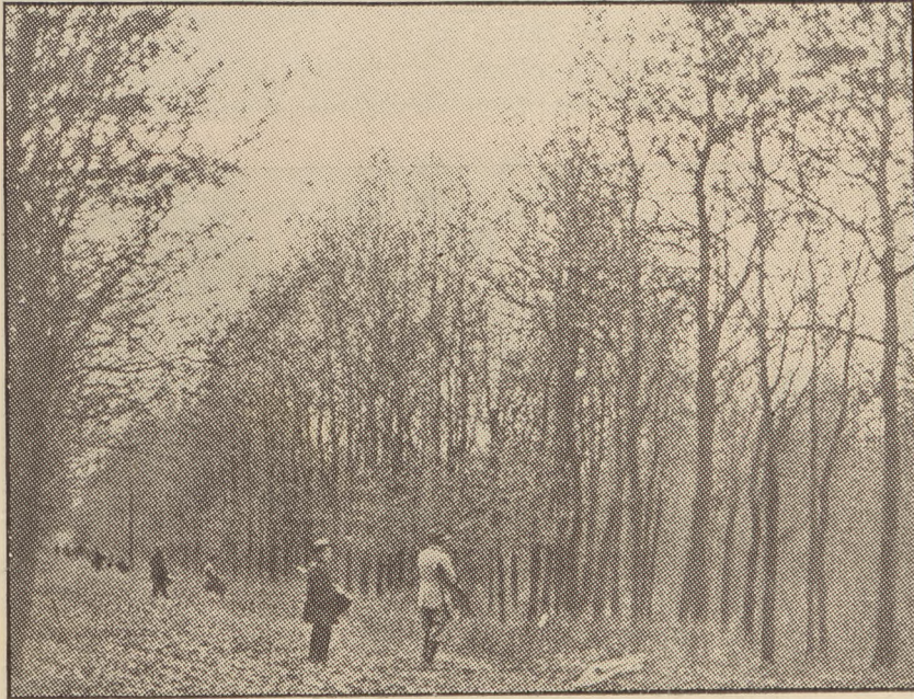
Pierwsze jesienne polowanie.

Z siewem oziminy związane są liczne zwyczaje. Oto tam, gdzie siew był rozpoczęty, potrząsano słomą, by nie tylko w ziarno, ale i w słomę przyszły plon był obfity. Z siewem jesiennym związane też są liczne przy-