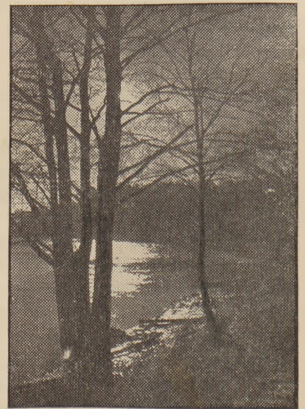
Wieczór nad jeziorem.

Zabiegi wróżebne wykonywane w wieczór wigilijny św. Andrzeja są bardzo różnorodne i bogate. Najpospolitszą wróżbą jest np. lanie z wosku, a w zamożniejszych domach cyny lub ołowiu. Szczególniej zna-