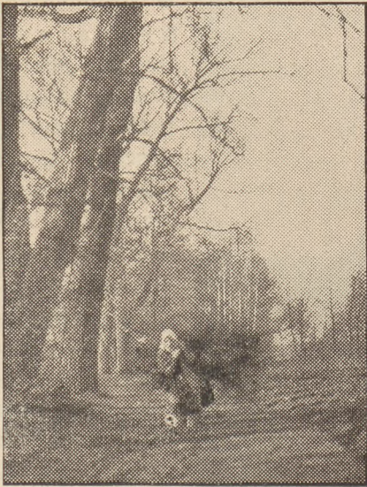
Pod brzemieniem chróstu.

czy szare mgły, otulające świat, radość i melancholia, płynące z opustoszałych pól i огоłoconych drzew, wszystko to stanowi część naszej duszy i stanowi jakąś więź tajemniczą, która nas wszystkich rozproszonych po świecie łączy w jeden naród.