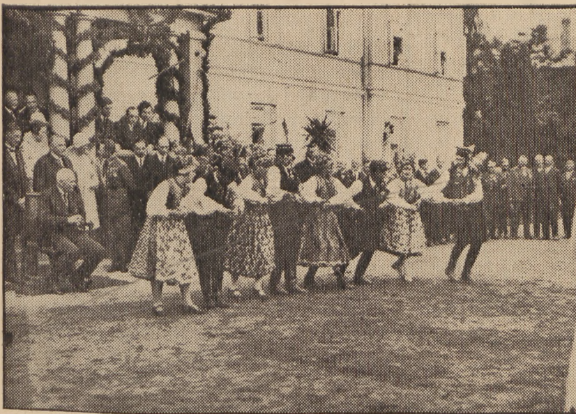
Śmiejąca się i tańcząca za szczęśliwe żniwa wieś polska przed Panem Prezydentem.

Już długo przed oznaczoną godziną gromadzą się liczne rzesze Polonii orłowskiej i okolicy przed budynkiem polskiej ochronki w „Zimnym Dole” w Orłowej, by manifestować swe pochodzenie i przywiązanie do swej ziemi ojczystej i jej