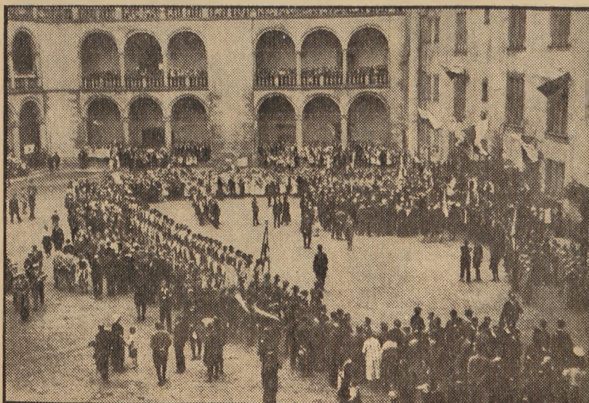
W całej Polsce snują się dożynkowe pochody w blasku jesienno-słonecznego słońca.

sługują tańce śląskie w strojach ludowych. Młodzież spisała się dziarsko.