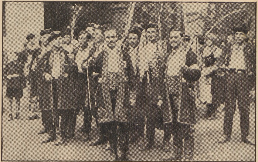
Ludowa orkiestra ma tu też swe święto.

Przy dożynkach ogólnopolskich gospodarzem może być tylko Głowa Państwa w towarzystwie gospodarzy i gospodyń wiejskich. Dożynki te mogą mieć duże znaczenie kulturalne i społeczno-wychowawcze, mogą być poważną uroczystością państwową. A winny być organizowane przez samo społeczeństwo wiejskie, bez żadnego przymusu, i to możliwie w większych odstępach czasu, by się nie zbanalizowały. Mają wtedy