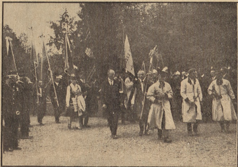
W chłopskich sukmanach

Dożynki organizowano początkowo w zasięgu powiatu i województwa z jednoczesnym pokazem prac danej organizacji, urządzającej dożynki. Wreszcie drogą ewolucji podjęto inicjatywę urządzenia uroczystości dożynekowych o charakterze ogólnokrajowym, przyczym gospodarzem przyjmującym od delegacji poszczególnych ziem całej Polski plon żniwny w postaci symbolicznych wieńców — był Pan Prezydent Rzeczypospolitej. Takie ogólnopolskie dożynki odbyły się po raz pierwszy w r. 1927 w Spale.