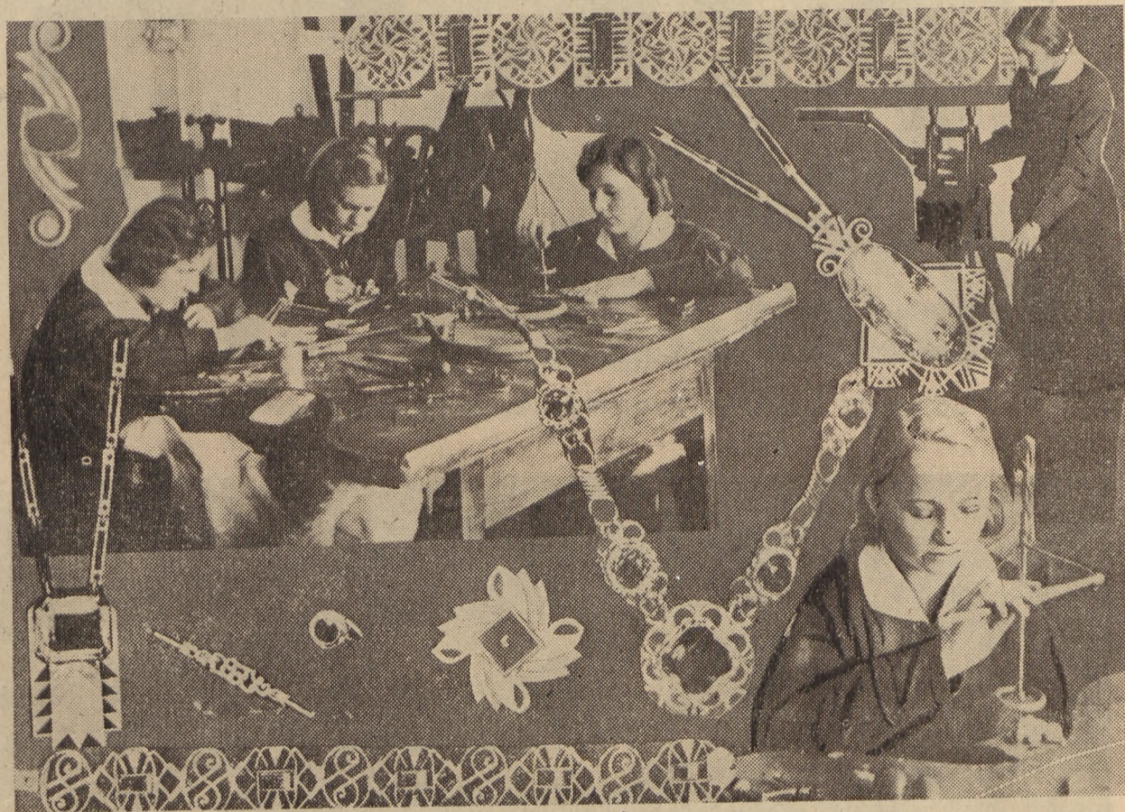
Państwowa Szkoła Przemysłowa w Łodzi. — Wydział jubilerski.

kiego uczy dana szkoła. A więc wykładający np. ekonomię w zawodowej szkole gospodarstwa domowego zaczyna przede wszystkim od zwrócenia uwagi uczennic na fakt, że pomyślna gospodarka całego narodu uzależniona jest od dobrego funkcjonowania wszystkich, nawet najmniejszych, gospodarstw prywatnych. Wykładowca język polski stara się w odpowiednio dobranych czytankach i wyjątkach dzieł wielkich pisarzy przedstawić wychowankom wartość pracy jednostek. Przytoczę tu ciekawy spis rozdziałów w nowym podręczniku do nauki języka polskiego w żeńskich szkołach przemysłowych: 1. Przy warsztacie. 2. W świecie maszyn. 3. Trud uczonych i artystów. 4. Głosy ziemi. (Związek obywatela z ziemią ojczystą). 5. Dla ojczyzny. (Obowiązek pracy dla swego kraju). 6. Bądźmy braćmi. (Wysoko