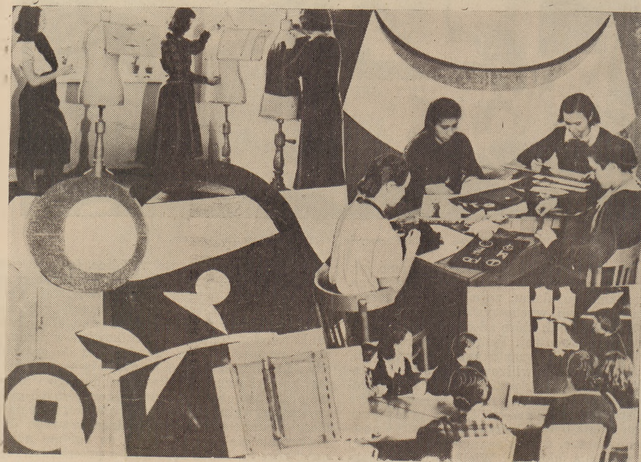
Publiczna Szkoła Doksztalająca Żeńska dla pracownic rzemiosła krawieckiego w Warszawie.