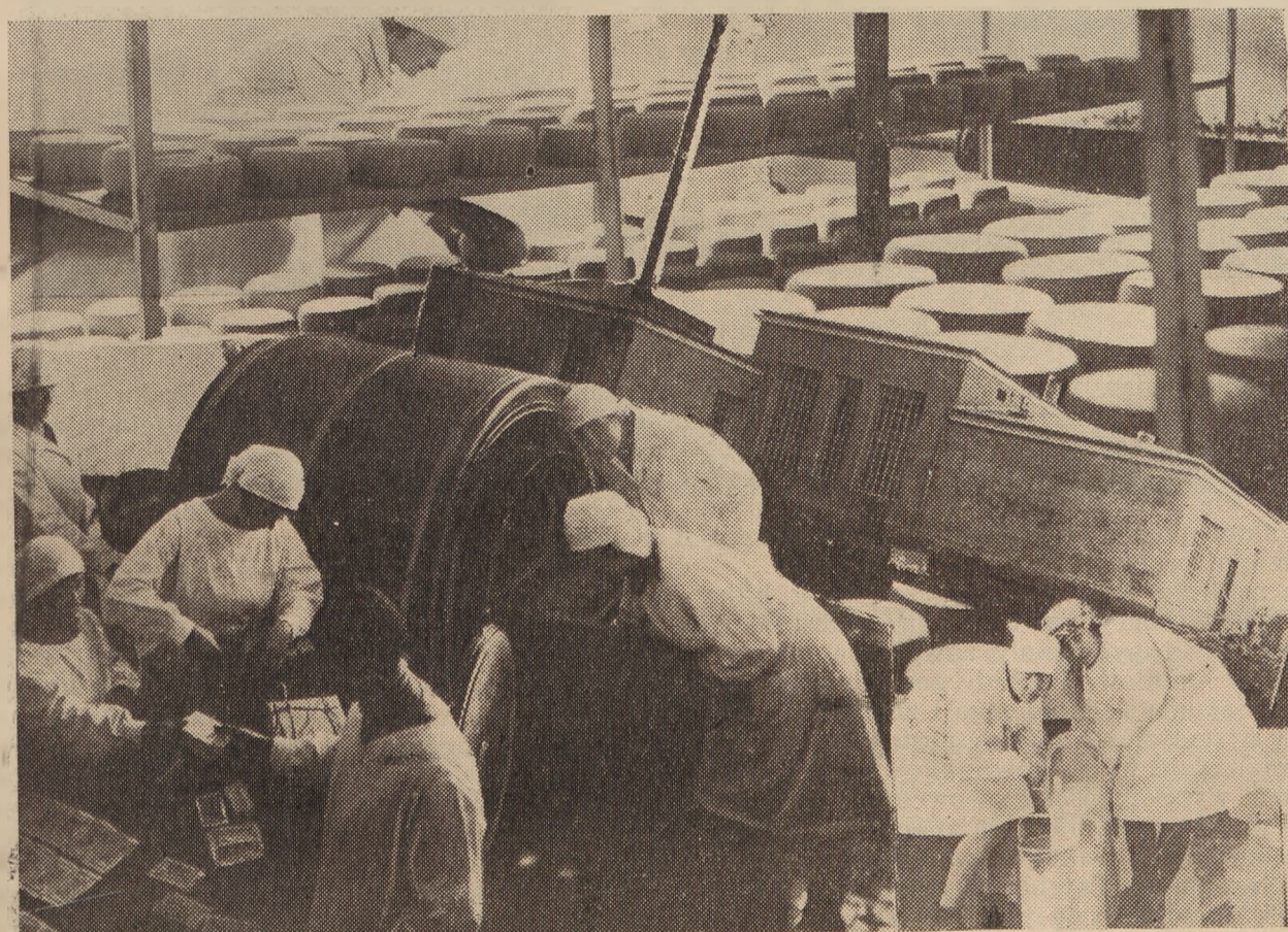
Szkoła Mleczarsko - Serowska Tow. „Służby Obywatelskiej” w Szafarni k/Rypina.