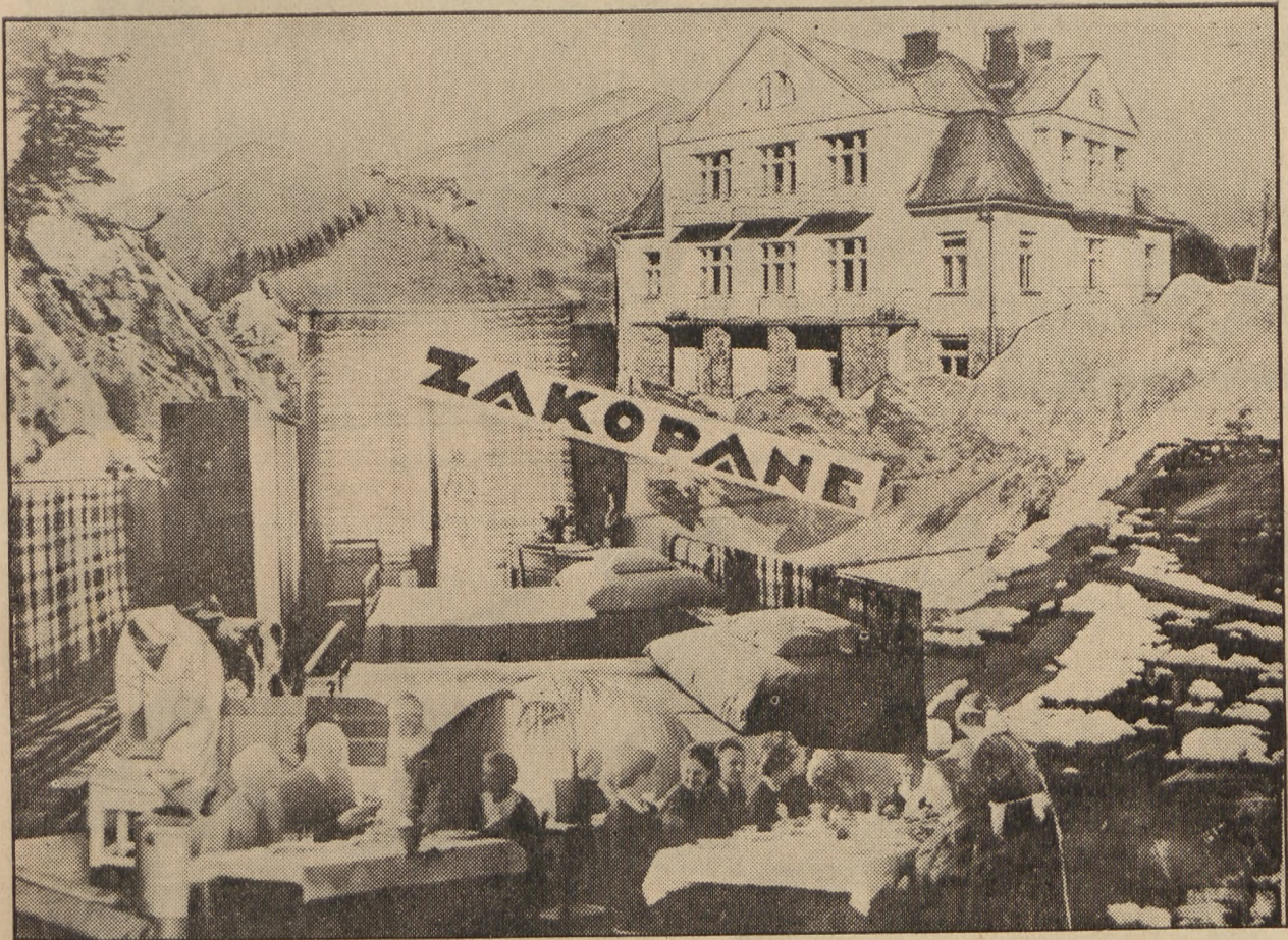
Państwowa Szkoła Przemysłu Hotelarskiego w Zakopanem.

Jeszcze przed stu laty w Polsce, tak samo jak i w innych krajach, kobiety pracowały głównie na terenie rodzinnego domu, zajmowały się gospodarstwem domowym, wychowywaniem dzieci i zawiadywały zarobkami, które zdobywał mężczyzna w swej pracy zawodowej. Tylko kobiety wiejskie od wieków pracowały wraz z mężczyzną na roli.