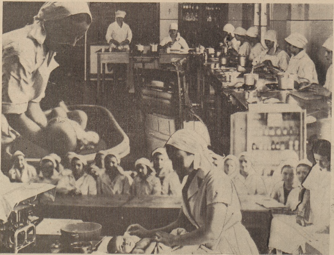
Państwowe Seminarium Nauczycielek Gospodarstwa Domowego w Krakowie.