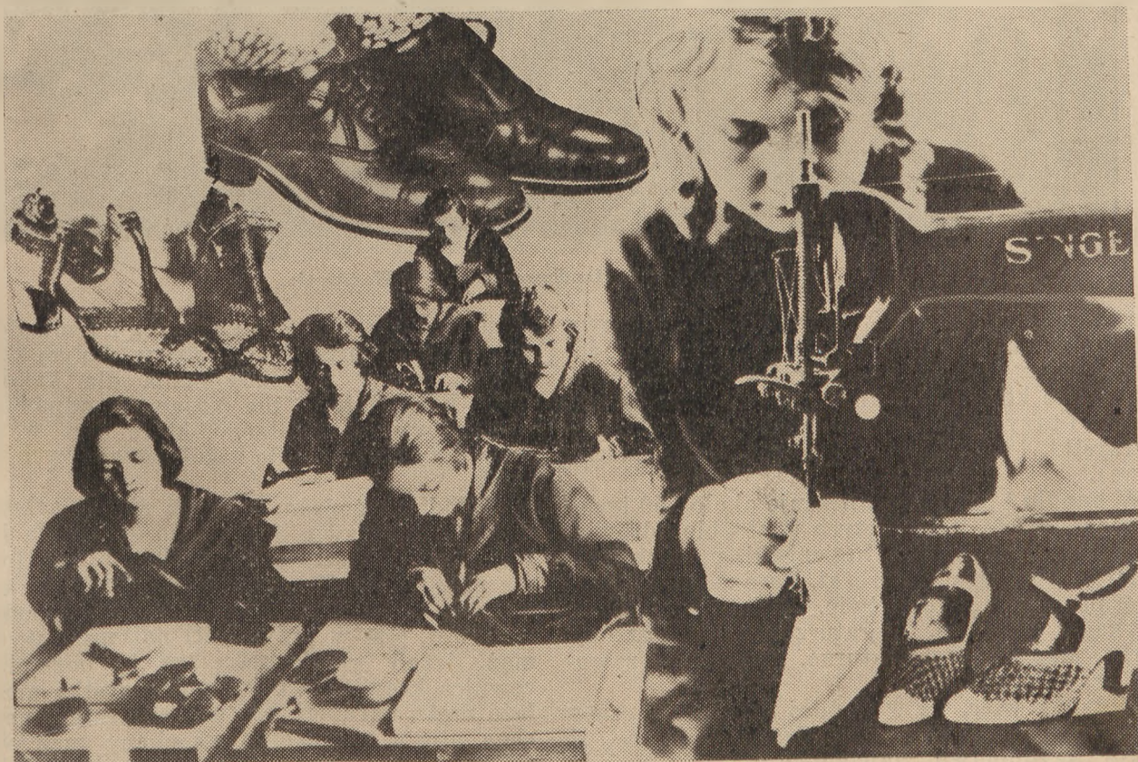
I. Miejska Szkoła Rękodzielnicza w Warszawie. — Wydział kamasznictwa.

Kobiety w Polsce pracują dziś w różnych zawodach i mają równocześnie możliwość wstępu na wyższe uczelnie, oddając pracę swą na usługi Ojczyzny. Do jednych zawodów garną się maso-