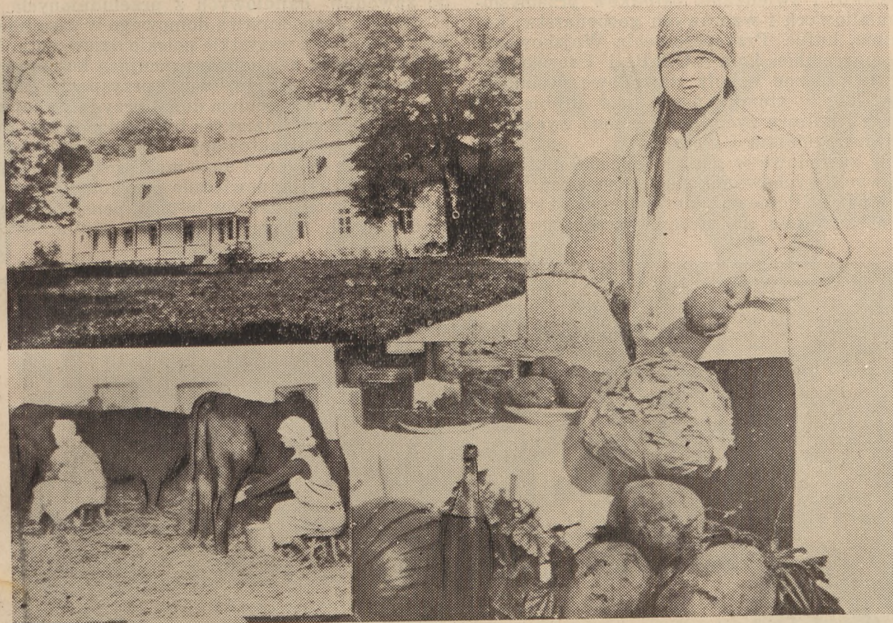
Roczna Szkoła Przystosobienia Gospodarstwa Wiejskiego w Różance Białostockiej.