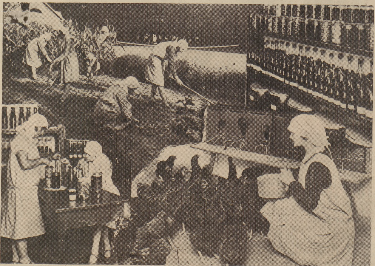
Prywatna Szkoła Gospodarstwa Wiejskiego im. E. Plater-Zyberkówny w Chyliczkach pod Warszawą.