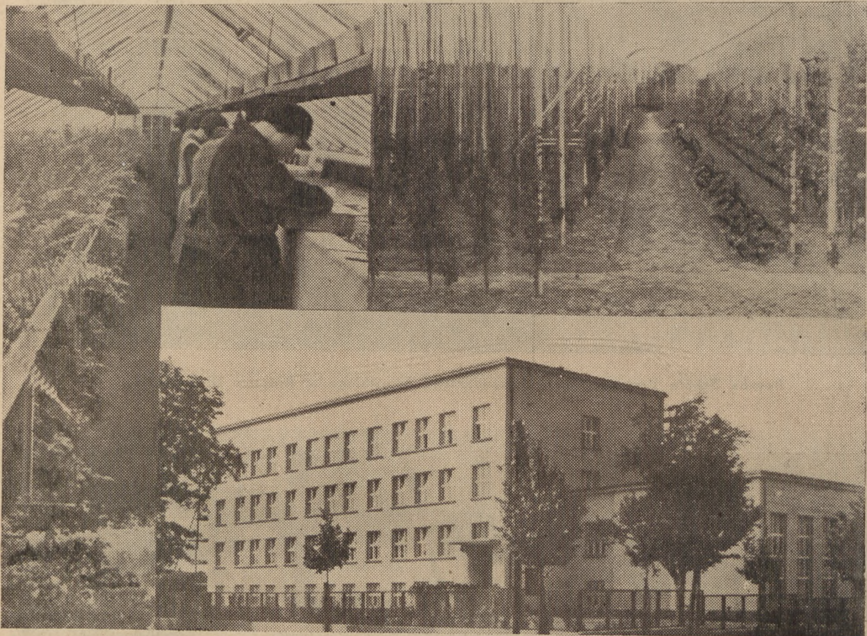
Państwowa Szkoła Ogrodnicza w Poznaniu.

Szkoły gospodarstwa domowego w zasadzie powinny ukończyć wszystkie polskie dziewczęta. Małżeństwo każdą zawodowo pracującą kobietę może wyrwać z jej zawodu, więc przysposobienie do pracy nad prowadzeniem domu przyda się jej zawsze. Do niedawna dział ten był niedoceniany przez same kobiety i traktowany często nieprzychylnie. Jednak daje on nawet duże możliwości zarobkowe. Ciągłe braki są odpowiednio przygotowanych kierowniczek hoteli, obozów letnich, pensjonatów, zarządzających gospodarstwem w szpitalach itd.