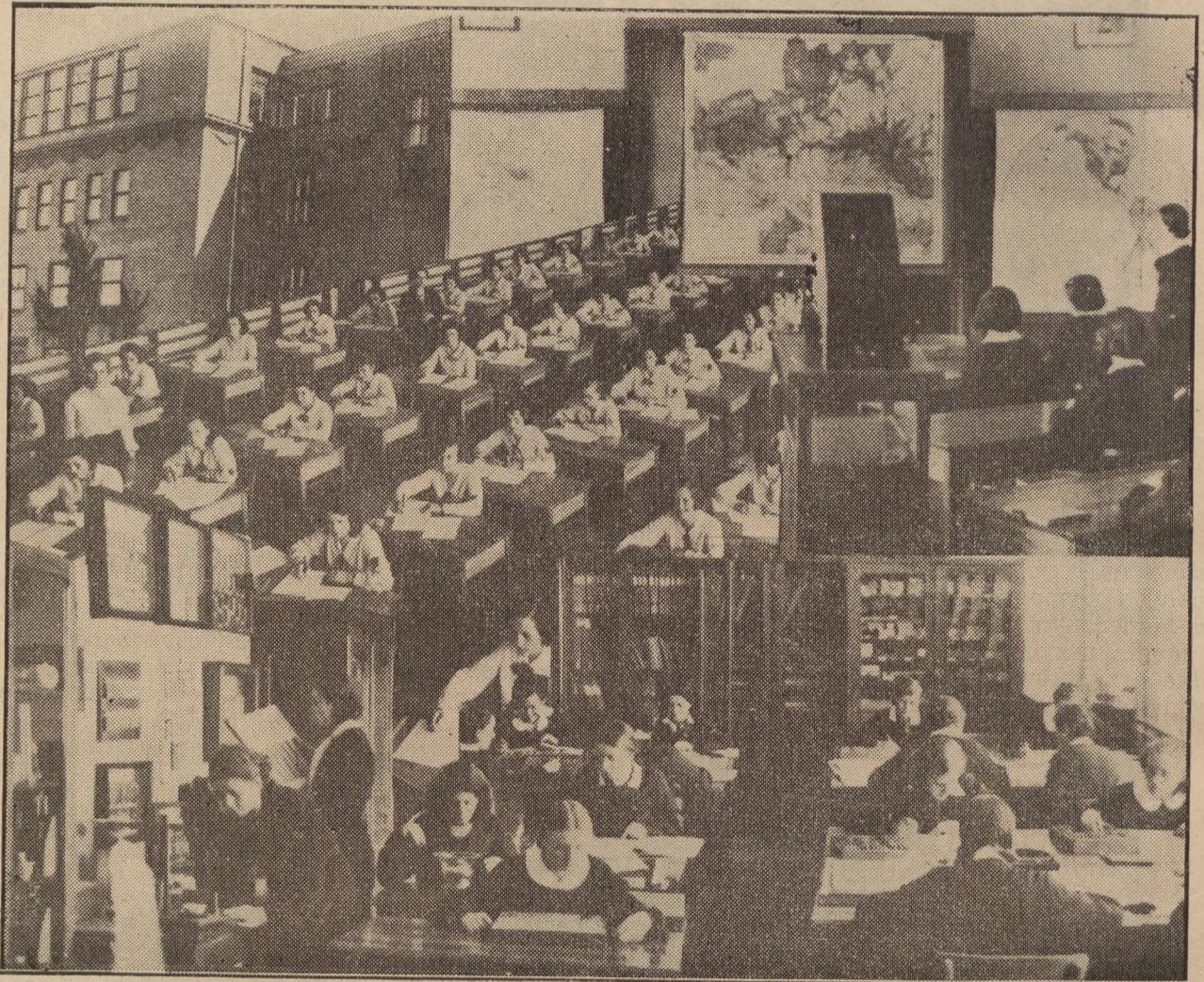
Państwowe Liceum Handlowe Żeńskie w Warszawie.

Współczesna organizacja pracy wymaga kwalifikacji zawodowych różnych stopni. Obok pracowników o wyższym poziomie wykształcenia, którzy zajmują stanowiska kierownicze, potrzeba całej armii podkomendnych. Jednak nasze szkolnictwo zawodowe, oparte na szczerze demokratycznych podstawach, dąży do tego, aby wszystkim kategoriom pracowników udostępnić zdobywanie wiedzy. Zatem obok szkół zawodowych różnego