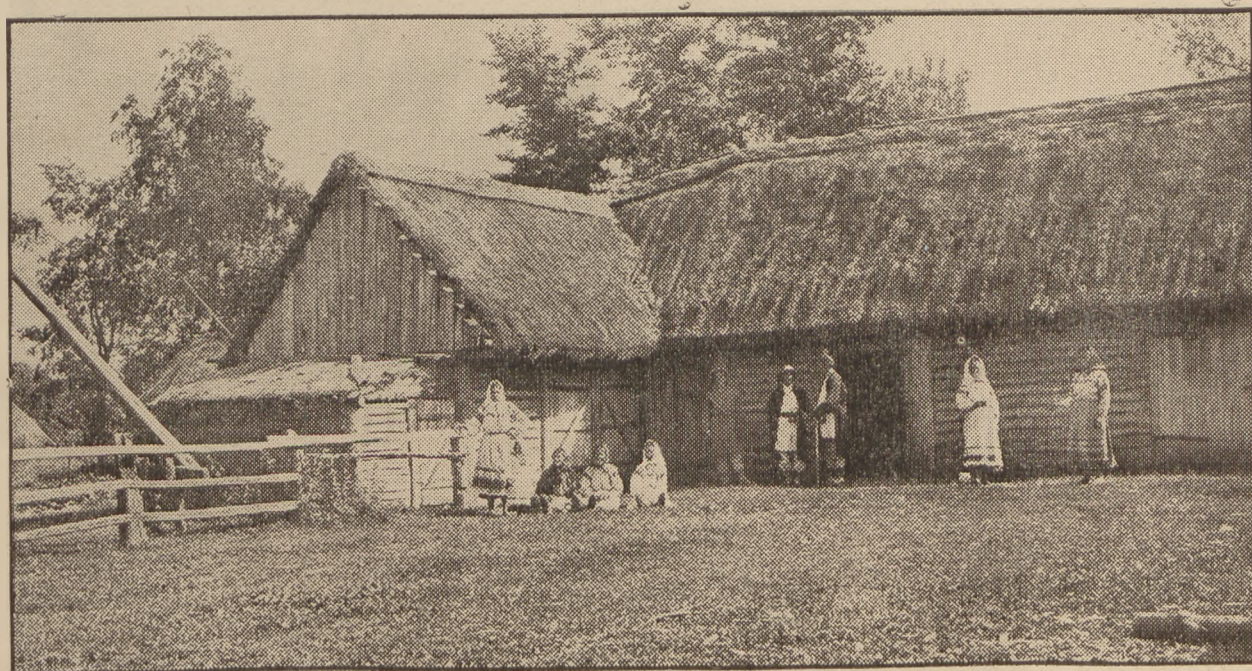
Obejście poleskie w Żeleźnicy.

Na doroczny jarmark 22 sierpnia ściągają Poleszacy z całego Polesia. Czego się wówczas nie widzi... Tu góry całe ślicznych kształtem garnków,