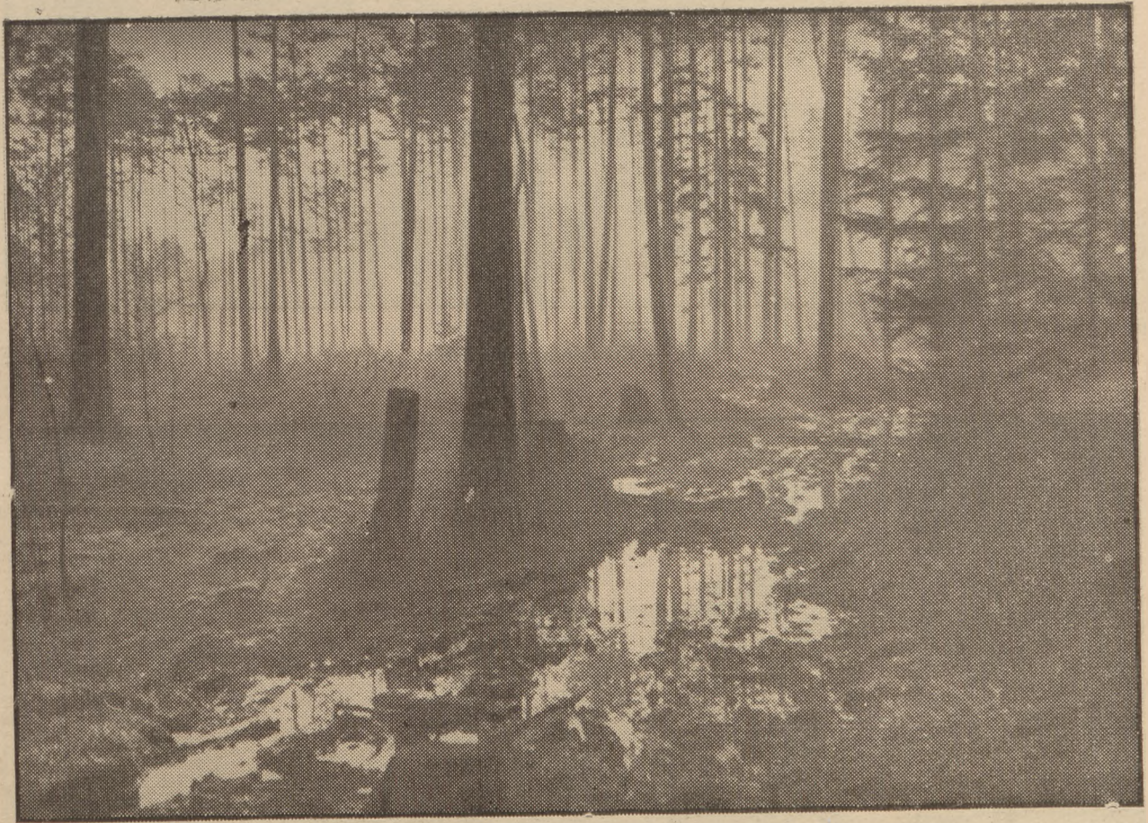
Las poleski na bagnie.