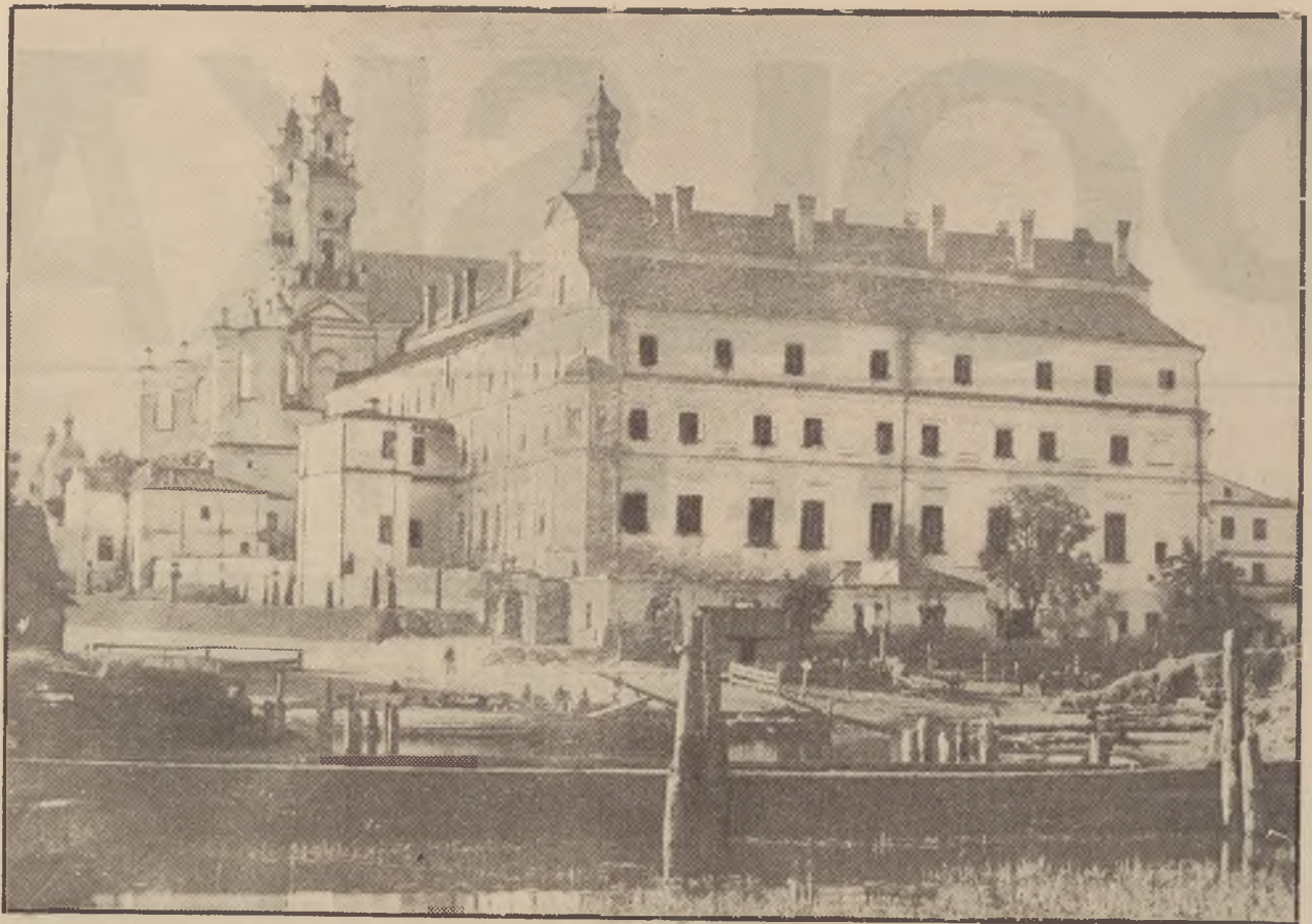
Pińsk — Kolegium pojezuickie.