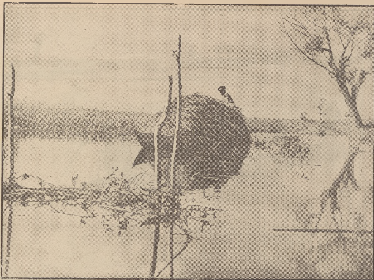
Przewóz łódką siana.