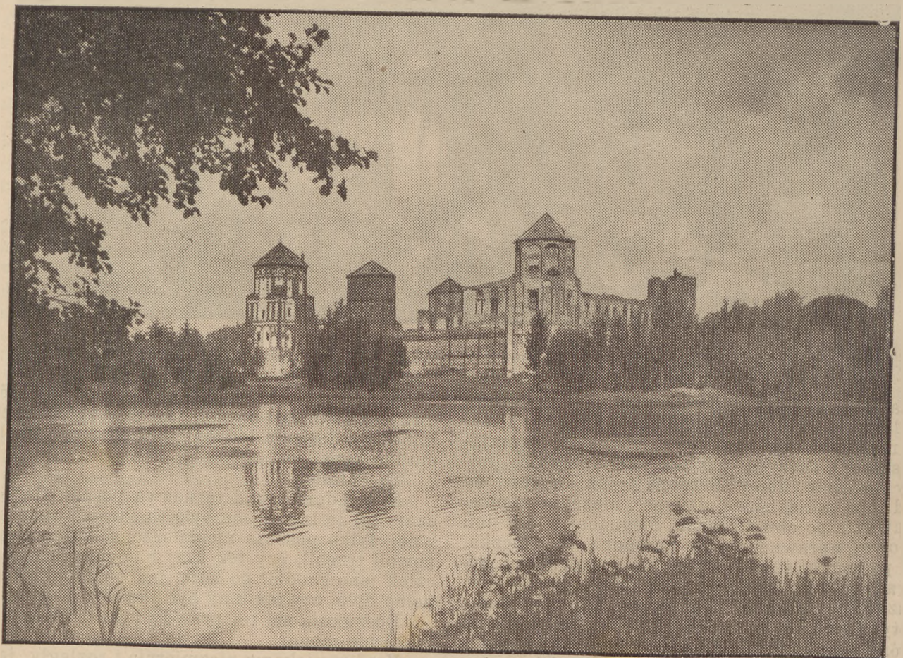
Zamek w Mirze.