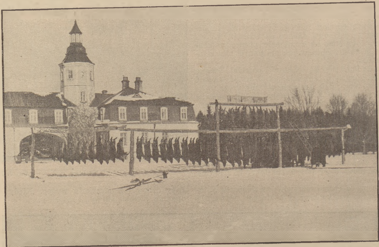
Mankiewcze — Polowanie na wilki.

Wogóle w ostatnich latach życie na Polesiu zaczęło płynąć nieco żywszym, niż woda w Pinie, nurtem.