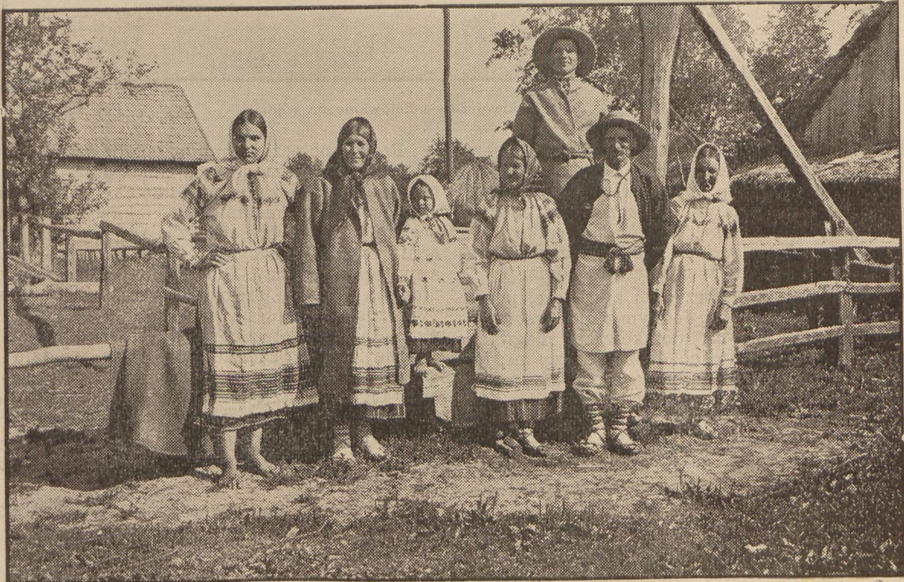
Typy poleskie z Żeleźnicy.

kępy drzew i zamieszkałe wyspy. Kiedy woda opadnie, zielenią się łąki i moczary.