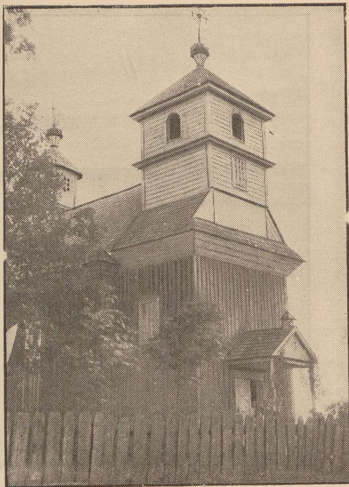
Cerkiew pounicka w Dobrosławce.

Rynek i ulice zatarasowane wozami, a raczej wózkami; na Pinie i kanałach takie zatrzesienie łodzi i łódek, że poprostu suchą nogą, skacząc