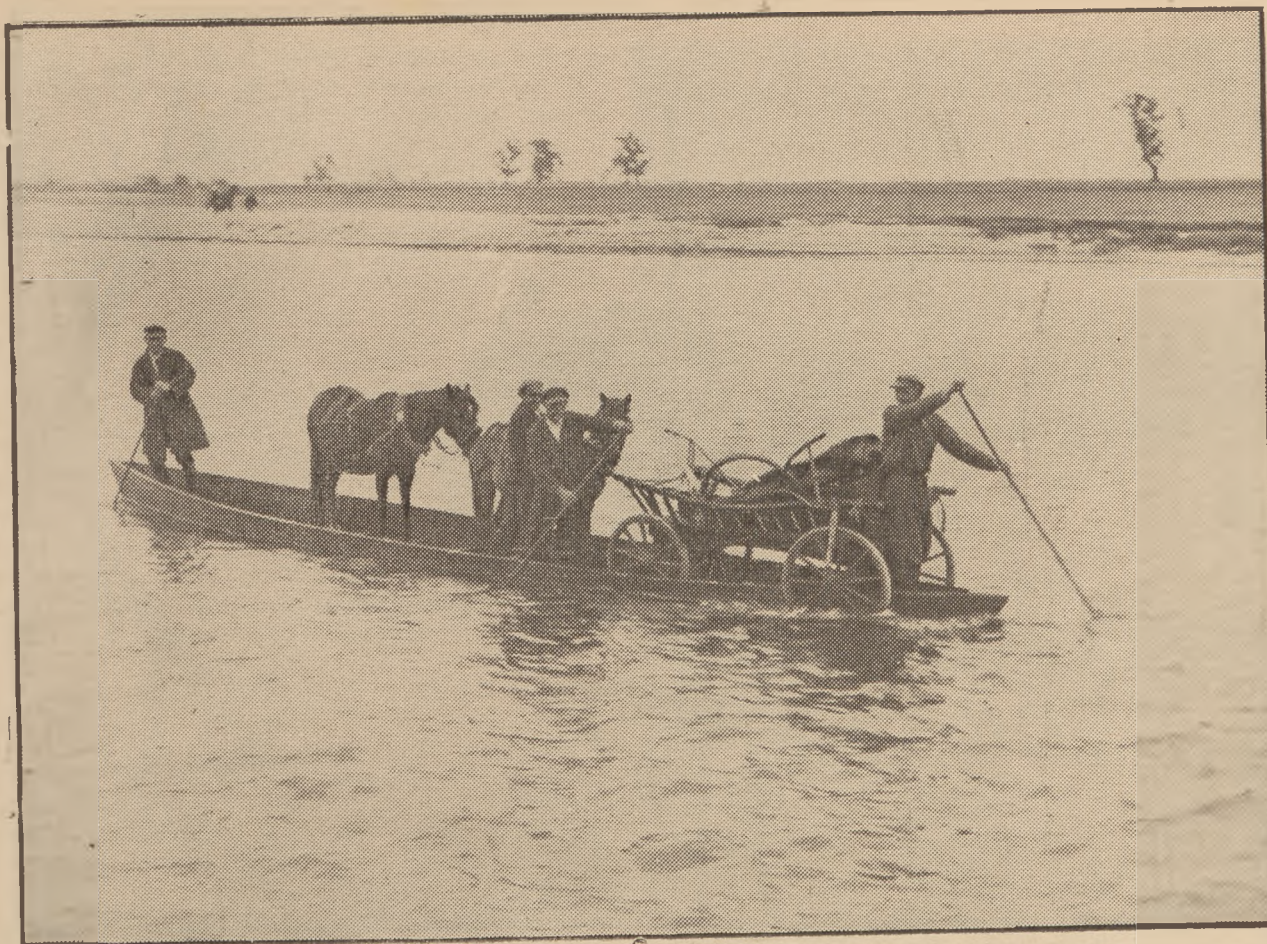
Przeprawa wozu przez rypec.