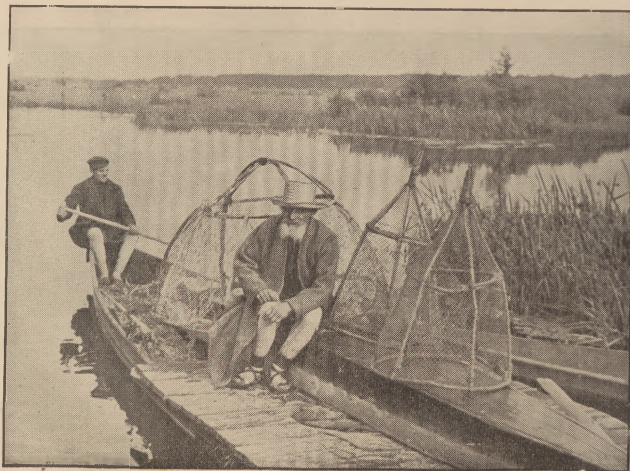
Rybak na Prypeci.