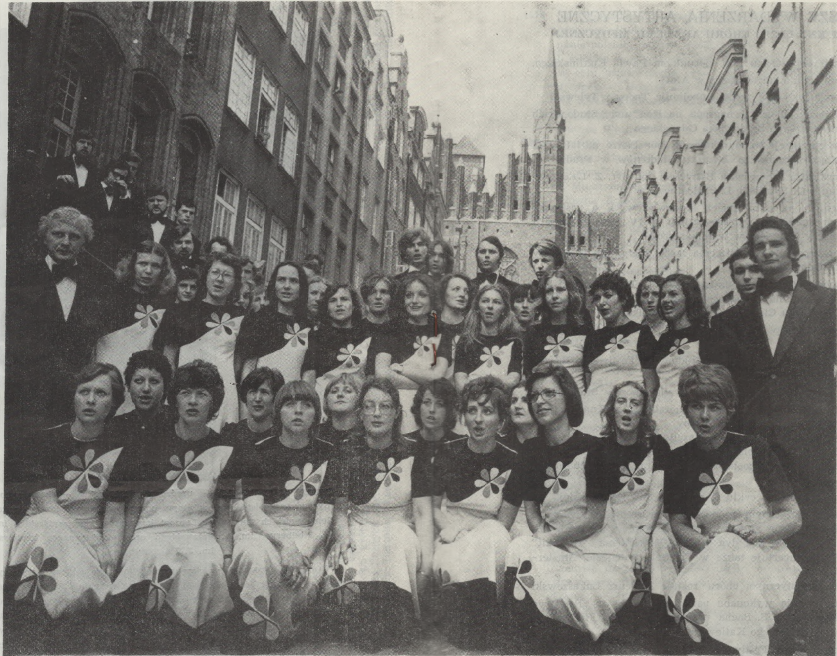
CHÓR AKADEMII MEDYCZNEJ IM. TADEUSZA TYLEWSKIEGO