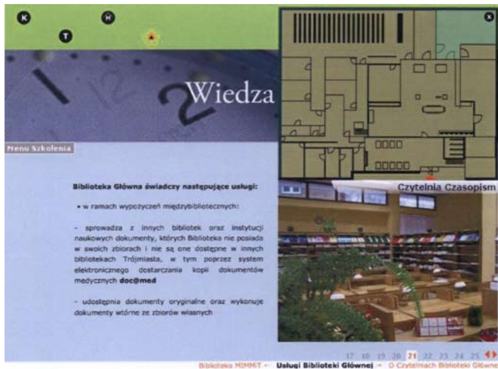
Ryc. 3. Interaktywny plan Biblioteki Głównej AMG ( http://biblioteka.amg.gda.pl/szkolenie )

Szkolenie kończy się testem sprawdzającym, zawierającym 20 zamkniętych pytań dających możliwość uzyskania maksymalnie 20 punktów. Niektóre z nich mają formę ćwiczeń i wymagają praktycznego wykorzystania katalogu VIRTUA. Test dostępny jest tylko dla studentów I roku AMG, po zalogowaniu się przez podanie imienia, nazwiska i numeru albumu. Jego zaliczenie następuje w momencie udzielenia ponad 50% pozytywnych odpowiedzi. Osoba, która uzupełniła test i dołączyła do niego ankietę, wysyła je do bazy otrzymując finalnie informację o zaliczeniu bądź nie zaliczeniu szkolenia. W tym ostatnim przypadku ma możliwość ponownego przystąpienia do testu i powtarzania go aż do skutku. Uzyskane przez poszczególne osoby wyniki, data odbycia szkolenia oraz ilość podjętych prób w celu zaliczenia testu, zapisywane są w specjalnie do tego celu stworzonej bazie, dostępnej tylko dla uprawnionych bibliotekarzy i stanowią podstawę dokonania wpisu do indeksu i wygenerowania protokołów egzaminacyjnych.