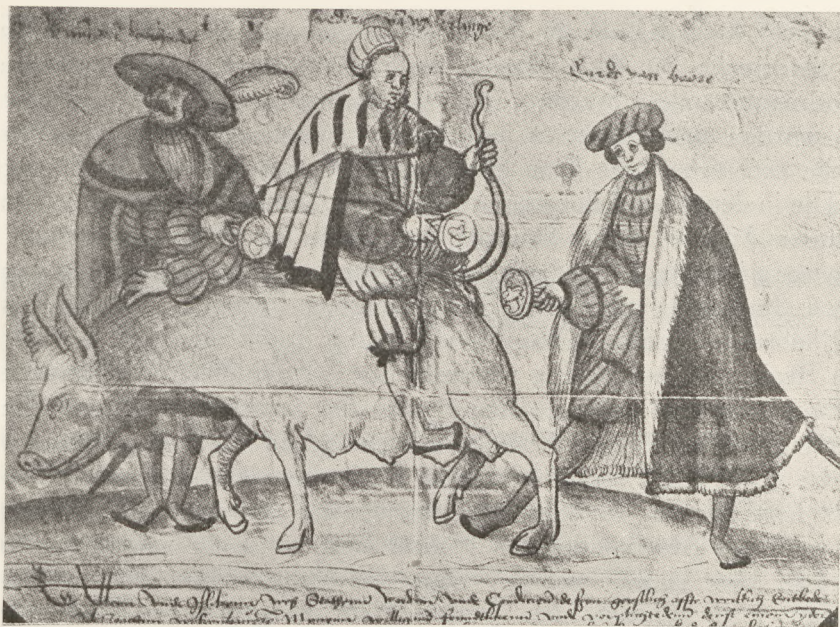
Fig. 3. Baklängesritt. Bild från ett kravbrev, förmodligen från 1500-talet. Efter Jahrbuch für historische Volkskunde, I, Berlin 1925, s. 107.

ten; men då ha känslorna blivit honom övermäktiga, och utan någon övergång utbrister han: »Jag drack en dryck i Stockholm, som förtärer sinnet, glädjen och all min välfärd på denna världen. Min käre herr faders ödmjuka son och tjänare Nils Sture, den elände.» 113 Förvisso har Nils Sture med dessa bittra ord givit uttryck åt kval, som före honom tusentals namnlösa genomlidit.