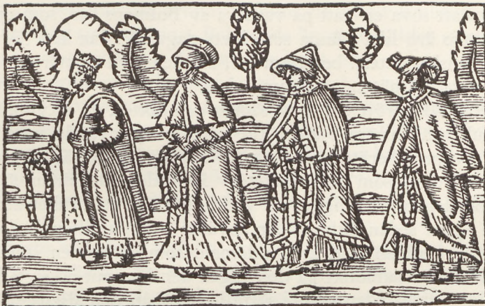
Fig. 2. Kvinnor iklädda mantlar. Efter Olaus Magnus, lib. XIV: cap. 1.

Dråparens tragiska skuld, hans lidande och djupa förnedring samt den slutliga försoningen — det var allt motiv, som måste tilltala den folkliga