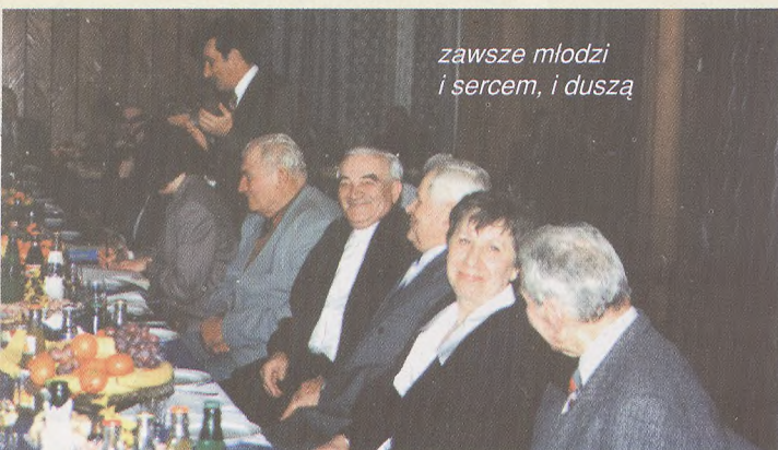
zawsze młodzi i sercem, i duszą