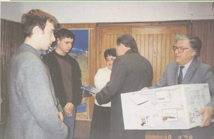
Wręczenie I nagrody zespołowej dla zespołu z ZSG-G-D Warszawa