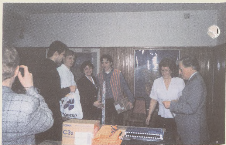
III nagrodę odbiera zespół ZS nr 6 Wrocław