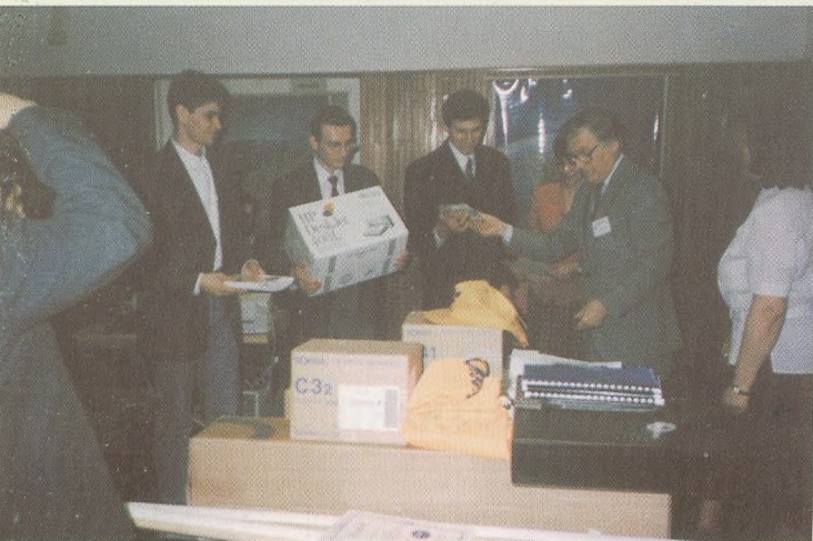
II nagroda dla zespołu ZSD-G Jarosław