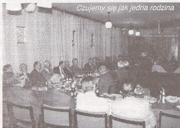
Czujemy się jak jedna rodzina