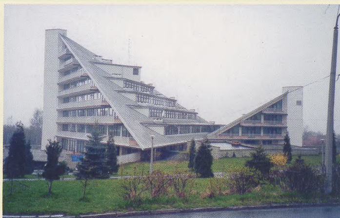
Zakwaterowanie i obrady plenarne Hotel „Magnolia” ul. Szpitalna 15