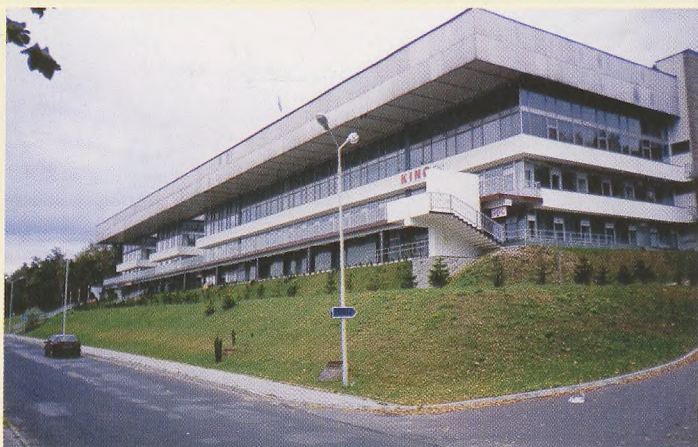
Otwarcie Zjazdu Delegatów SGP Kino „Zdrój” ul. Sanatoryjna Nr 7