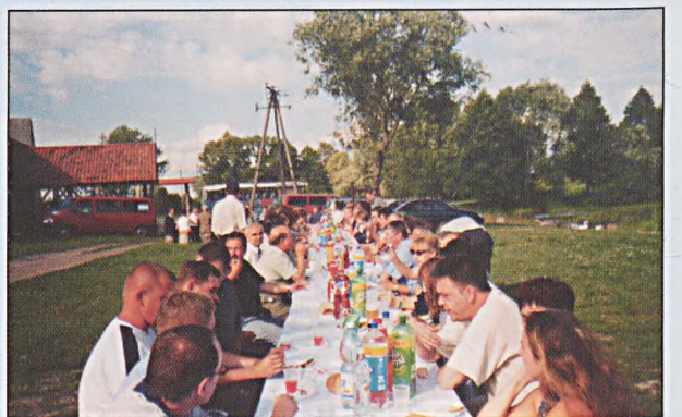
Spotkanie koleżeńskie nad rzeką Narew