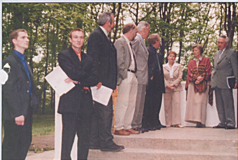
Moment oczekiwania na rozpoczęcie obrad