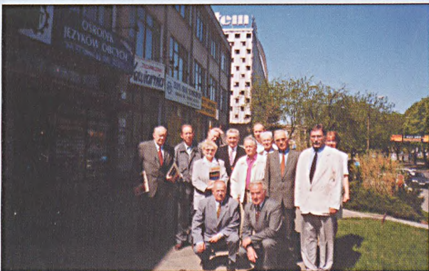
Uczestnicy spotkania przed Domem Technika