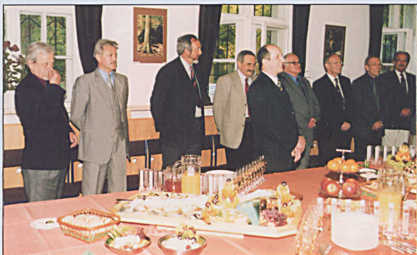
Organizatorzy i zaproszeni goście w chwilę przed toastem podsumowującym obrady