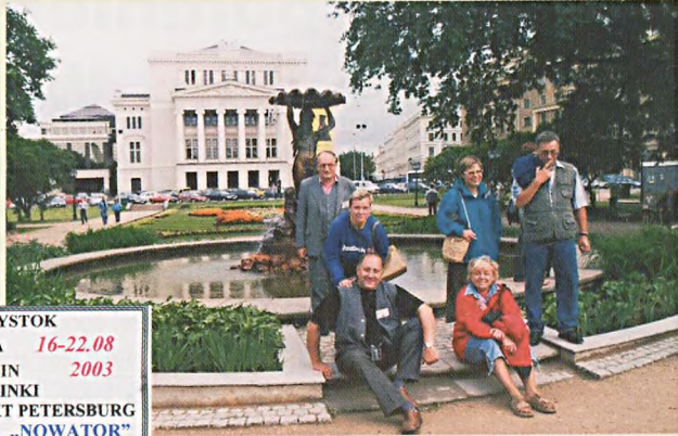
Geodeci na tle budynku opery w Rydze