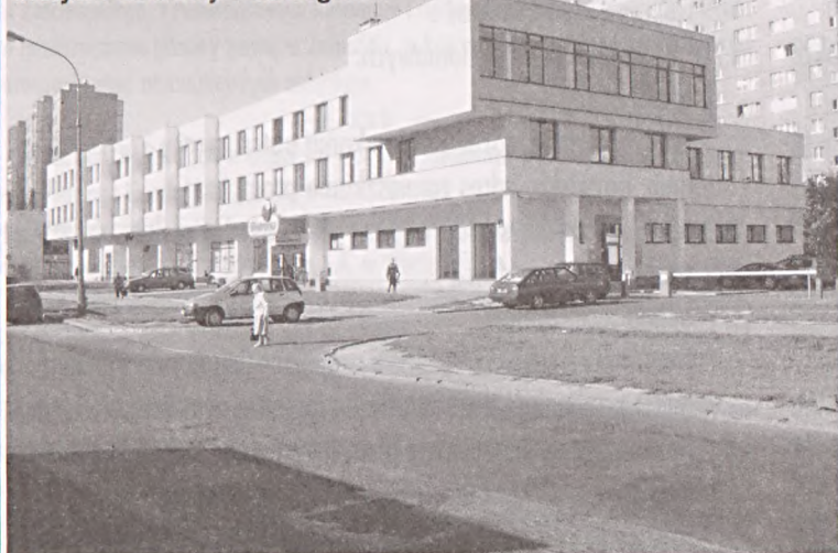
Budynek w którym mieści się obecnie Instytut Geodezji i Kartografii.

Prace wnioskowane do nagród zostaną zwrócone po rozstrzygnięciu konkursu.