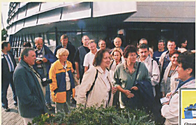
Grupa przed domem towarowym w Rydze