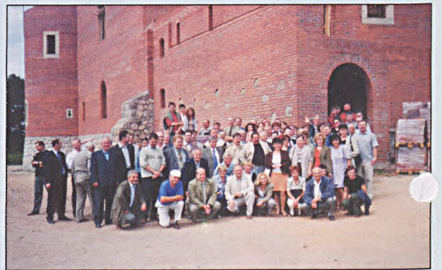
Uczestnicy zebrania na tle odbudowywanego zamku