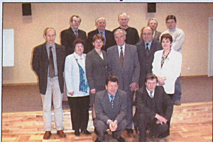
Ustępujący Zarząd Oddziału SGP w Białymstoku w pełnym składzie

W dniu 9 stycznia 2004 roku w Domu Technika NOT w Gdańsku odbyło się oplatkowe spotkanie członków Zarządu i komisji problemowych Oddziału SGP.