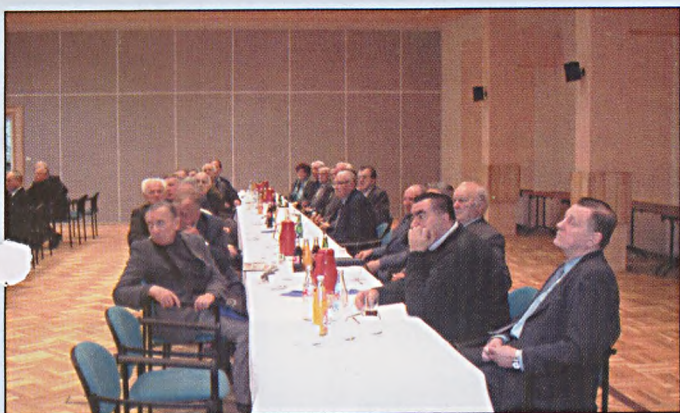
Spotkanie z emerytami i rencistami

W dniu 9 grudnia b.r. Prezydium Zarządu Oddziału SGP, zorganizowało spotkanie święteczno - noworoczne dla członków SGP będących emerytami i rencistami.