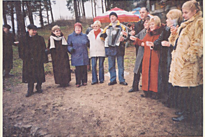
Zaczerpnąć świeżego powietrza