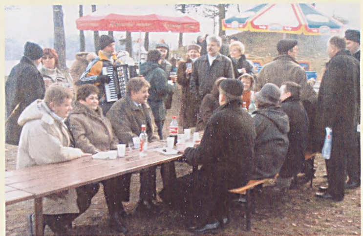
Bal w plenerze