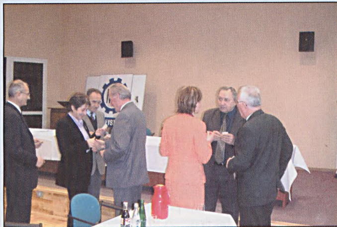
Spotkanie z emerytami i rencistami, dzielenie się opłatkiem