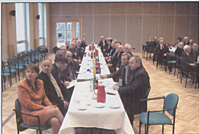
Spotkanie z emerytami i rencistami