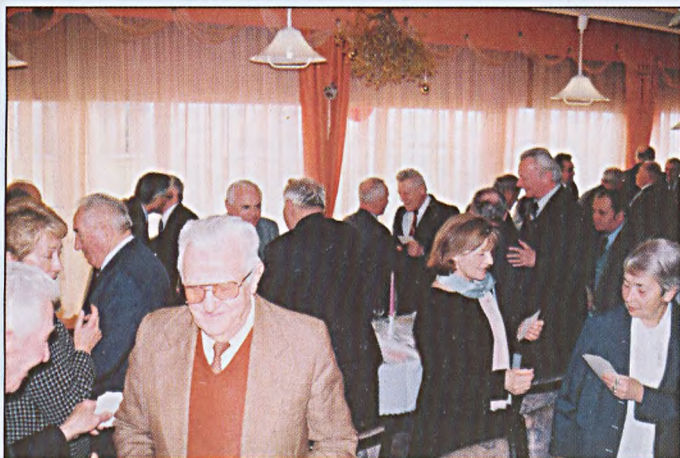
Składając sobie życzenia dzielimy się oplatkiem

Do kalendarza oddziału rzeszowskiego na trwałe w okresie Świąt Bożego Narodzenia weszło spotkanie oplatkowe Prezydium z Seniorami SGP. W tym roku uczestniczyły w nim 52 osoby.