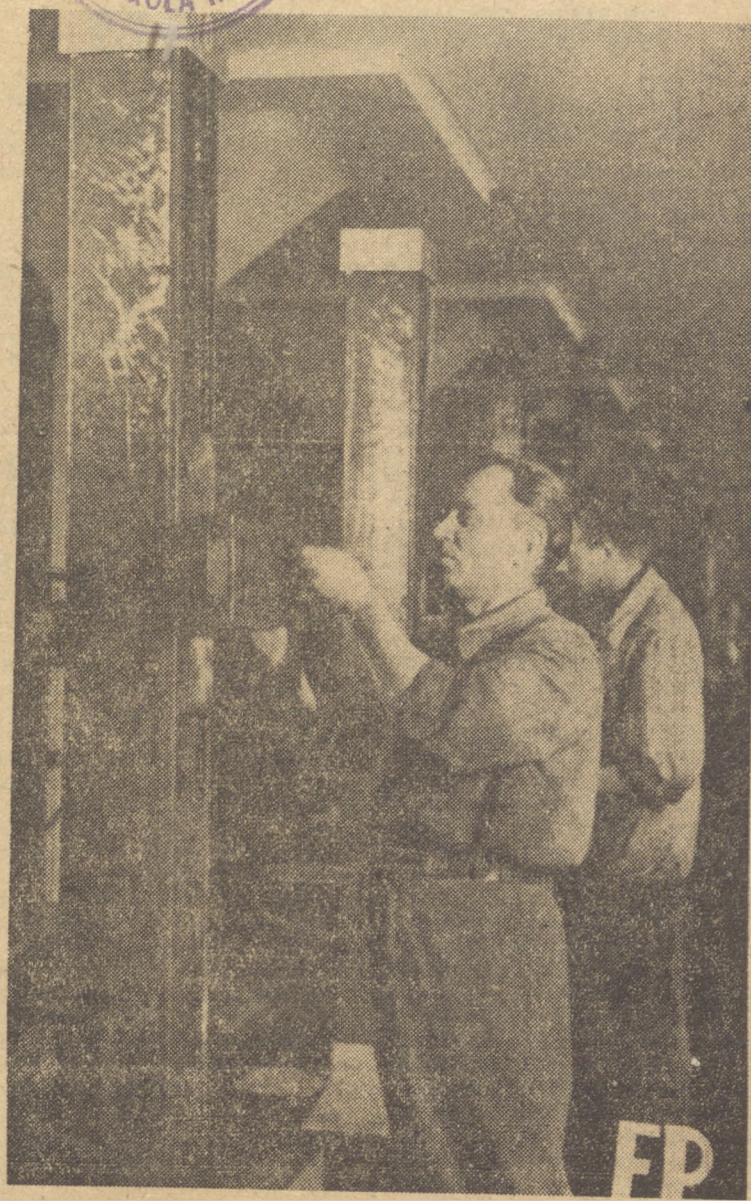
Panstw. Fabryka Aparatów Elektrycznych (dawn. Szpołańskiego) jest jedyną w Polsce Fabryką produkującą aparaty rentgenowskie. Zdjęcie przedstawia fragment produkcji polskiego aparatu do prześwietlenia.