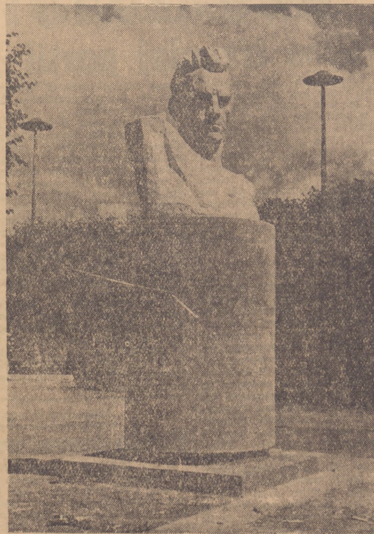
Rzeźba przed pawilonem „Czterech kopuł“.

RZYM 24.7. (PAP). Około 300 członków włoskiego Frontu Młodzieży miało w tych dniach wyjechać do Bułgarii i Czechosłowacji, aby u boku innych organizacji młodzieżowych z różnych krajów Europy pomóc przy budowie kolei młodzieżowej w Czechosłowacji oraz przy budowie ośrodka przemysłowego Dimitrowgrad w Bułgarii. Wyjazd ten nie będzie mógł jednak dojść do skutku, ponieważ minister spraw wewnętrznych Scelba odmówił udzielenia im paszportów.