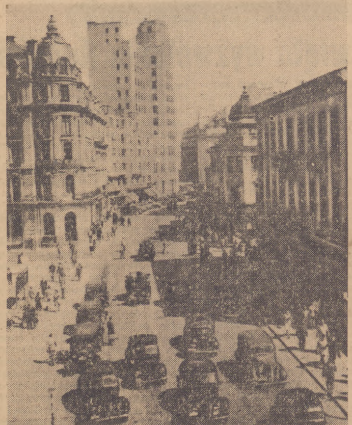
Główna ulica Bukaresztu, stolicy Rumunii — Calea Victoriei. (Artykuł poświęcony 4 rocznicy wyzwolenia Rumunii zamieszczamy na str. 2-jej).

Życzenia Amerykanów dla Kongresu Intelktualistów