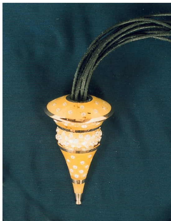
Wisior autorstwa Radosława Kaźmierczaka - praca przeszła do finału World Facet Award

A w przemówieniach oficjeli brzmiało to tak zachęcająco.