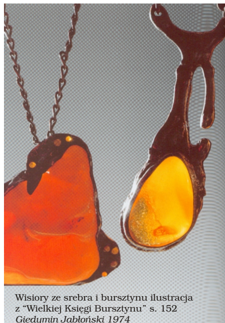
Wisioły ze srebra i bursztynu ilustracja z „Wielkiej Księgi Bursztynu” s. 152 Giedymin Jabłoński 1974

Autorzy zadbali o przedstawienie graficznych panoram dwóch najważniejszych ośrodków artystycznego bursztynnictwa w okresie nowożytnym: Gdańska i Królewca, a także zamków krzyżackich w Baldze i Fischhausen, które przez całe wieki chroniły zasoby