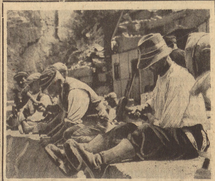
Górnictwo kamienniarne, zawód dawniej w Polsce nieznany. Fragment z pracy w kamieniołomach w Strzygoniu, największym tego rodzaju zakładzie w Europie. Patrz artykuł na str. 3

Dziś, część tych okrętów została z powrotem odebrana Polskiej Marynarce Wojennej przez admiralację brytyjską, inne zostały remontowane i są niezdadne do powrotu. Z wielu bohaterskich okrętów powraca do kraju tylko jeden: ORP. „Błyskawica“. Taki jest bilans walk Polskiej Marynarki Wojennej z flotą niemiecką u wybrzeży Wielkiej Brytanii.