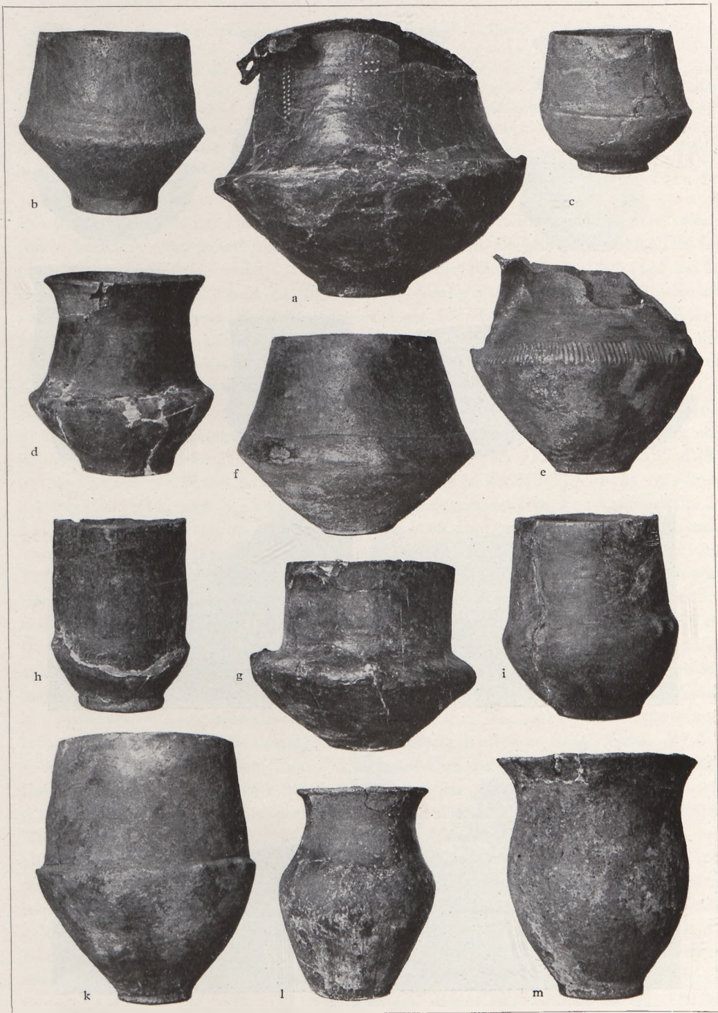
Tafel 2: Tonware der jüngsten Lausitzer Kultur aus dem Urnenfeld von Bachorz, Kr. Sanok. — a \frac{1}{7} ; b, d, h, k, m \frac{1}{6} ; c, e—g, i, l \frac{1}{6} nat. Gr. — Phot. Potocki.