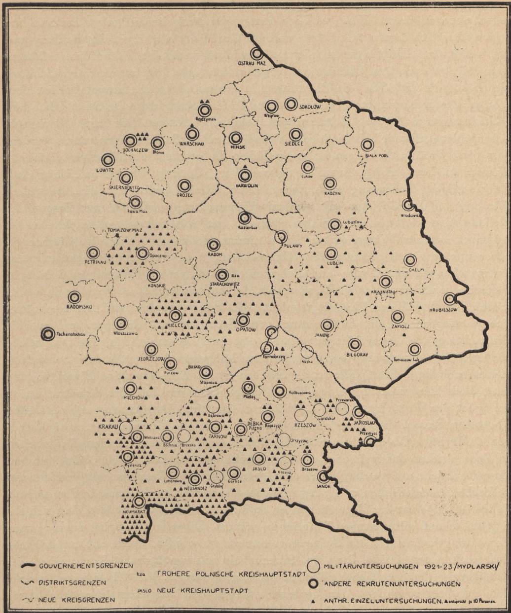
Übersicht über die polnischen anthropologischen Untersuchungen bis 1939

zu sprechen und die Ergebnisse nichtpolnischer Forscher wiederzugeben. Untersuchungen und Beobachtungen auf dem Gebiet der Erblehre liegen weder an Menschen noch an Tieren vor. Wissenschaftliche Verfahren und Arbeitsgrundsätze gewinnen dadurch ihre Rechtfertigung, dass sie durch die Lebensvorgänge und deren Beobachtungsergebnisse ihre Bestätigung finden. Solche Beobachtungen und die Durchführung von Vererbungsversuchen fehlen in der polnischen Anthropologie völlig.