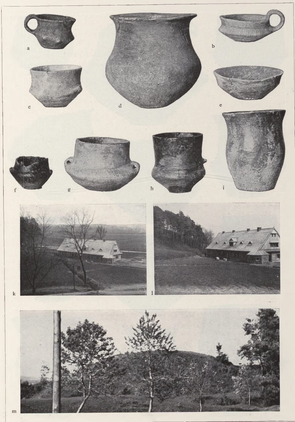
Tafel 3: Nordillyrische Tonware aus dem Urnenfeld von Bachorz, Kr. Sanok. — a—i etwa \frac{1}{4} nat. Gr. — k, l Fundplatz des Urnenfeldes zwischen Haus und Bach; Phot. W. Radig. — m Burghügel „Gewölbe“ am Urnenfeld, wohl frühgeschichtlich; Phot. A. Nowotny.