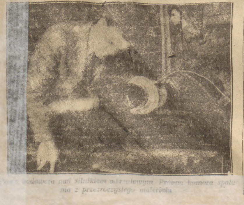
Woda utleniona natłuszczona azotanem. Próba komora spalania z przezroczystym materiałem

gólnym, konkretnym wypadku. Nie należy opierać się na prawach statystycznych i rozstrzygając odpowiednim materiałem rzeczowym, można by określić współczynnik, charakteryzujący wojowniczość epoki. Byłoby niewątpliwie obławem pożądanym, aby w dziejach rozwoju cywilizacji i udziale wojen, nie było tak niewinności małych, dążeń do zniszczenia.