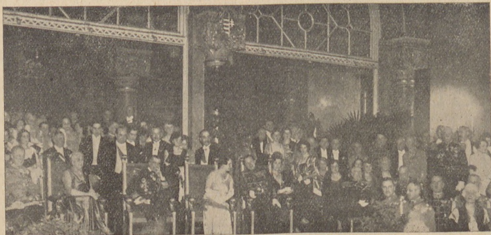
Bal Witeziów w Budapeszcie.

Amatorzy zabawy wybiorą się chętnie na ostatki karnawałowe do Budapesztu, przepięknej stolicy Węgier i posłuchają kuszącej cygańskiej kapeli, przy kieliszku tokaju.