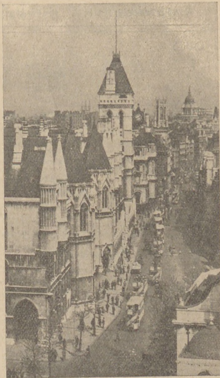
Ulica Fleet Street w Londynie.

Wszyscy uczestnicy wycieczki wezmą udział w reprezentacyjnym podwieczorku, wydanym przez Departament