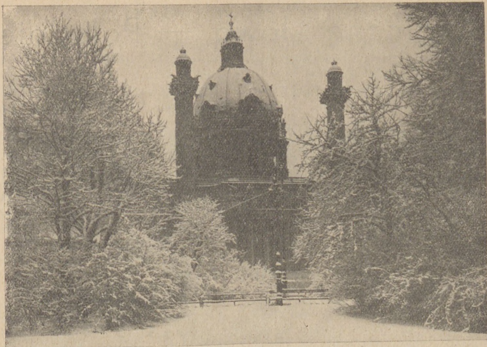
Kościół św. Karola w Wiedniu