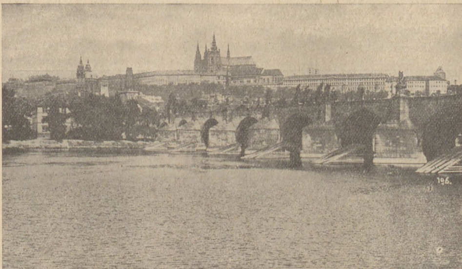
Widok na Pragę i Wełtawę.

W Pradze Czeskiej odbędą się wiosenne „Targi Praskie” w dniach 8 — 15 marca. W tym okresie będą organizowane wycieczki kupców i przemysłowców, oraz wyjazdy na dogodnych warunkach dla osób, chcących zwiedzić Targi.