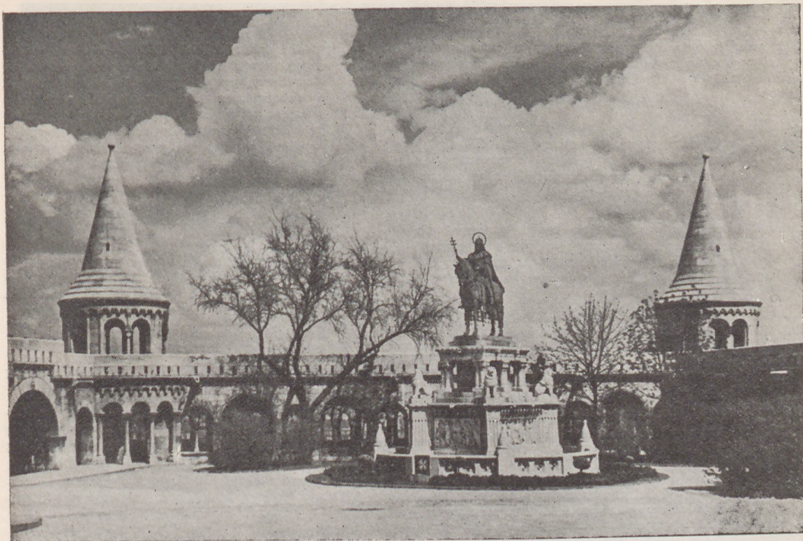
Budapeszt: Pomnik św. Stefana

Rzuconą ongiś myśl wcielono w piękny, szlachetny czyn.