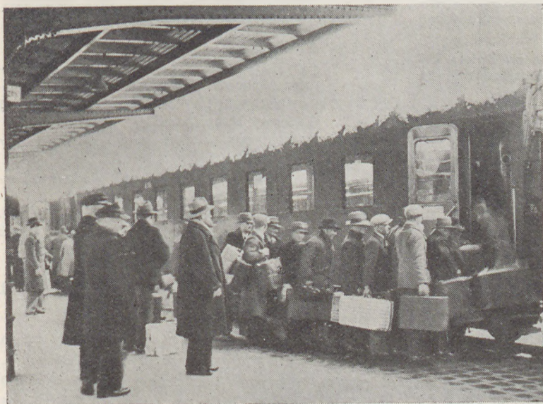
ZAWAGONOWANIE ROBOTNIKÓW ROLNYCH UCZESTNIKÓW TRANSPORTU ODPRAWIONEGO DO LUKSEMBURGA

Transporty robotników sezonowych odprawione przez »ORBIS« do Luksemburga i Estonii