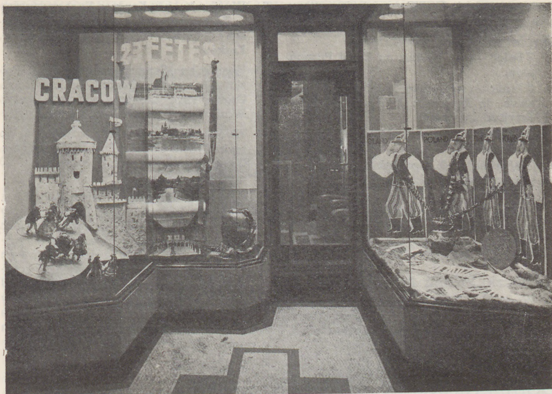
Oddział Orbisu w Londynie