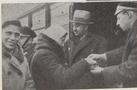
ODPRAWA NA STACJI POSTAWY ROBOTNIKÓW ROLNYCH SEZONOWYCH UDAJĄCYCH SIĘ Z WILEŃSZCZYZNY DO ESTONII