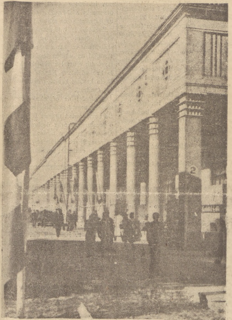
Pawilon wystawców zagranicznych