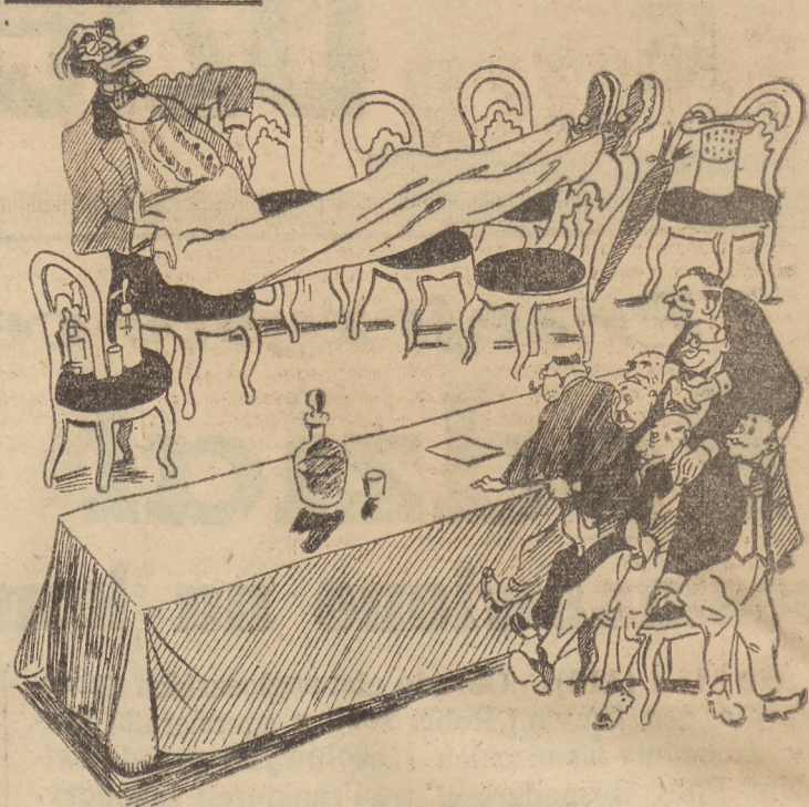
W CIASNYM GRONIE

(Wuj Sam do przedstawicieli małych państw): — Wszyscy usiedli! Teraz, jak równi z równymi rozpatrzmy zagadnienie waszej niezawisłości. „Krokodyl”