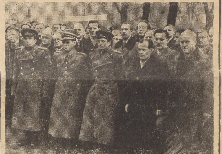
Zgromadzeni u stóp pomnika przedstawiciele miasta, Wojska Polskiego i Armii Czerwonej słuchają przemówienia prez. Al. Willnera.