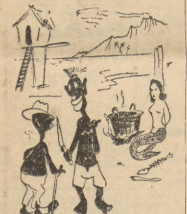
...w każdy piątek jem posne strawy.