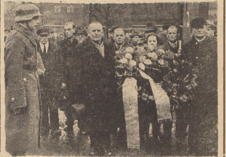
Warta honorowa pełni służbę. Hołd poległym składa powiat katowicki — w imieniu szerokich rzesz ludzi pracy...

Wstrząsy ziemi były tak silne, że sejsmografy nie mogły ich notować.