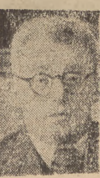
Amb. Hejret tych oklasków ambasador Hejret dziękuje ukłonem i łoży dyplomatycznej, za wyrazy szczerzej sympatii. Wicemarszałek

Związek parlamentarny polskich socjalistów popiera w całej rozciągłości konwencję i będzie za nią głosował.