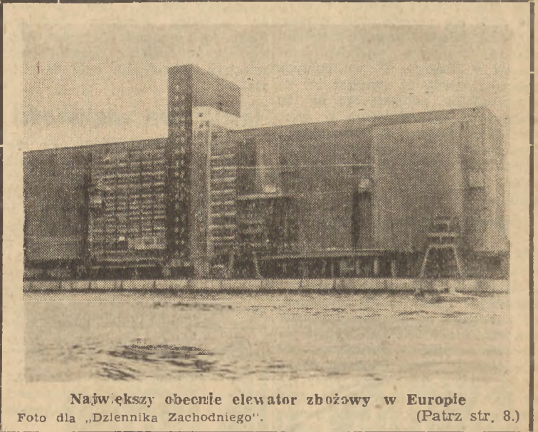
Największy obecnie elewator zbożowy w Europie (Patrz str. 8.)

W rezultacie Berlin stał się odcinkiem, na którym skutki separatystycznych posunięć 3 mocarstw